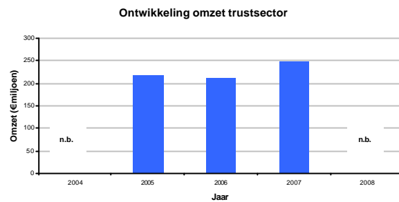
Figuur 1a en 1b

De Nederlandse trustsector heeft een zeer goede reputatie bij haar cliëntèle door het hoge niveau van dienstverlening. De omzet 10 van de trustkantoren bedroeg in 2007 € 247 mln. 11 miljoen afkomstig van 20,000 12 juridische entiteiten en 16,000 klanten. Volgens onderzoek van de Stichting Economisch Onderzoek (gelieerd aan de Universiteit van Amsterdam) zijn 80% van de klanten zakelijke cliënten en 20% vermogende particulieren.