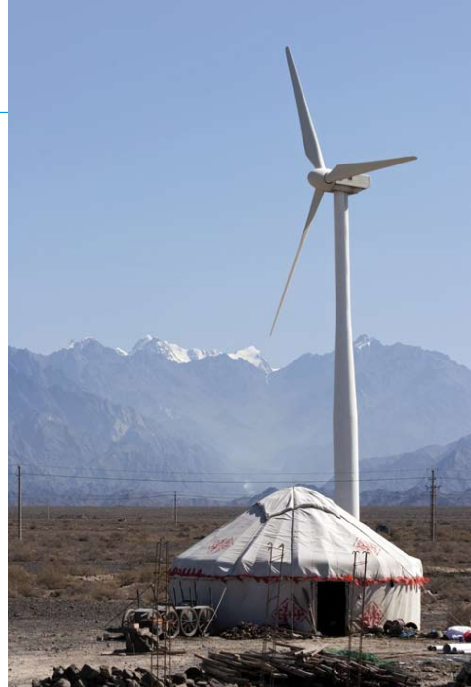
China en India kunnen hun energievoorziening meteen een stuk duurzamer maken

"Misschien niet zo publiekelijk. Mijn collega-ministers Gerda Verburg (Landbouw, Natuur en Voedselkwaliteit) en Bert Koenders (Ontwikkelingssamenwerking) waren de trekkers van dit onderwerp. Maar achter de schermen heb