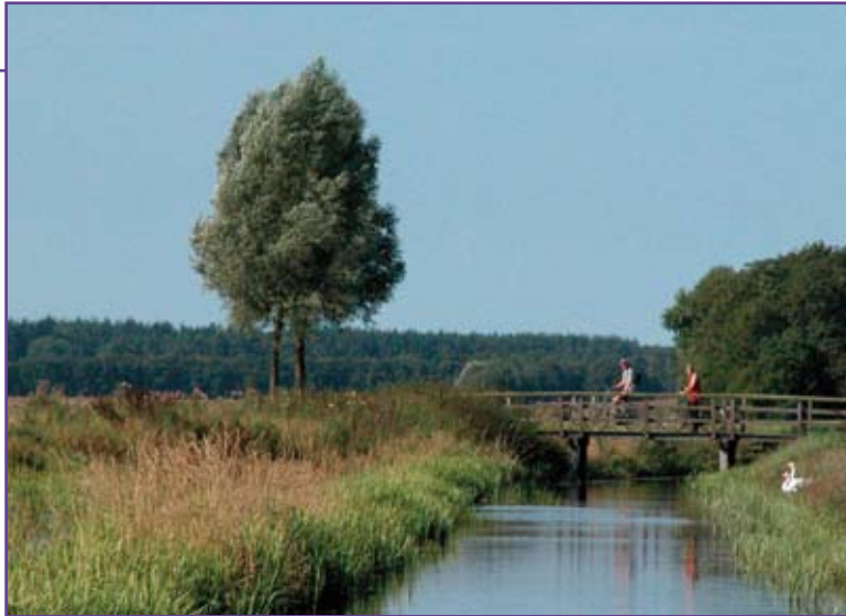
Fietsers in Breevenen

natuur zo min mogelijk belast. Om dat te bereiken heeft Waterleidingmaatschappij Drenthe aanzienlijk meer grond aangekocht dan puur voor de productie van drinkwater noodzakelijk zou zijn geweest. Hierdoor konden de winputten verder van elkaar geplaatst worden, waardoor ze elkaar veel minder beïnvloeden en verdroging van de bodem beperkt wordt. Dat betekent: minder schade voor de boeren én minder gevolgen voor de natuur.