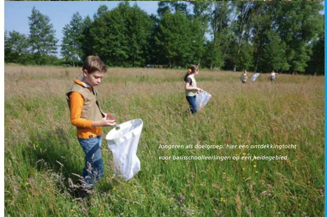
Jongeren als doelgroep: hier een ontdekkingsocht voor basisschoolleerlingen op een heidegebied