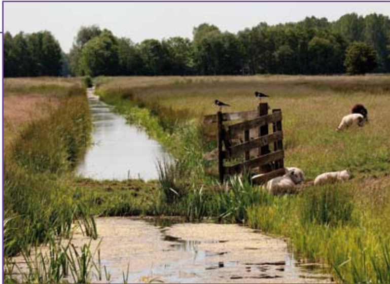
De Steeg bij Langerak

Dit samenspel van beheersmaatregelen levert positieve resultaten op, zo blijkt uit recent onafhankelijk onderzoek. Hierin concluderen ecologische onderzoekers dat de algemene tendens van de ontwikkelingen in het gebied "positief" genoemd mogen worden. "Gezien de resultaten wordt het gebied goed beheerd."