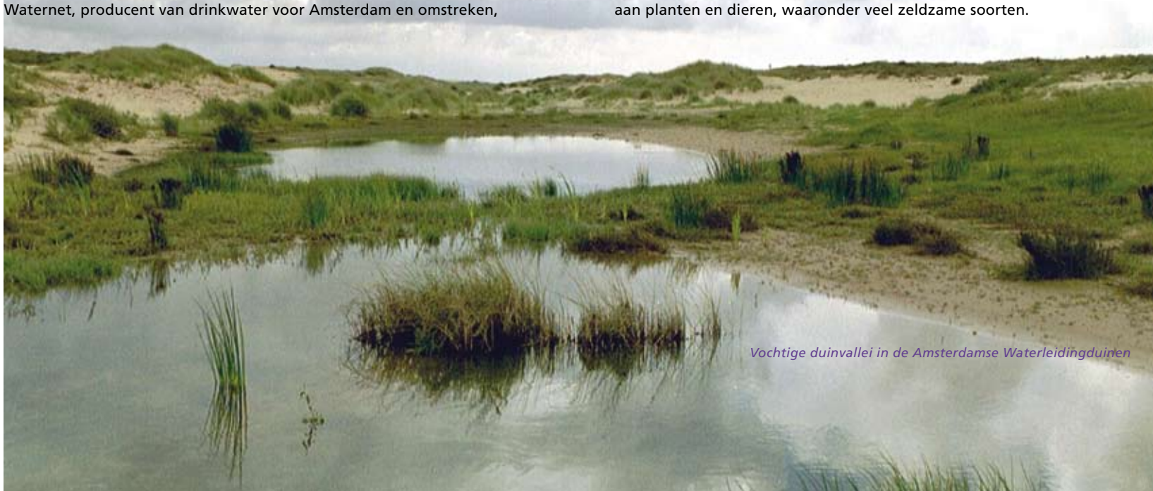
Vochtige duinvallei in de Amsterdamse Waterleidingduinen

Een prima plek om schoon en puur drinkwater te produceren. Tegelijk is het aan de waterwinning te danken dat het gebied voor de natuur behouden is gebleven en dat het een paradijs is voor natuurliefhebbers. Jaarlijks trekken de Waterleidingduinen zo'n 800.000 bezoekers. Door de invloed van wind en water zijn er veel verschillende natuurlijke leefmilieus ontstaan, van hoog naar laag, van droog naar nat, van kalkrijk naar kalkarm en van kaal naar dicht begroeid. Deze variatie zorgt voor een grote verscheidenheid aan planten en dieren, waaronder veel zeldzame soorten.