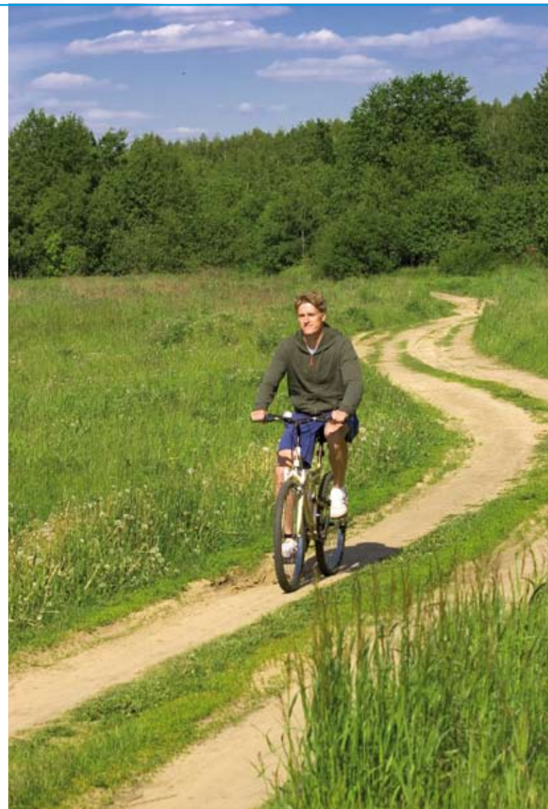
Recreanten zijn maar weinig geïnteresseerd in de soortenrijkdom

“Wijzen op de keuzes die gemaakt kunnen worden. Wat is het doel op langere termijn en welke beleidsgevolgen heeft dat? Nu lopen verschillende benaderingswijzen vaak door elkaar. Aan de ene kant heb je de puur ethische benadering,