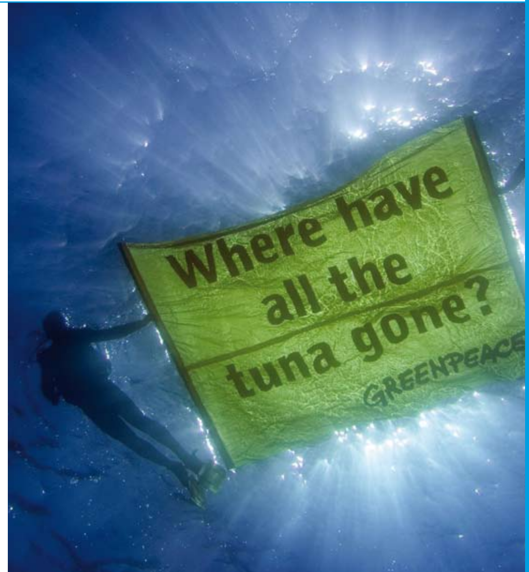
In zijn hart wil niemand verlies van biodiversiteit

"De versnippering is groot bij de Nederlandse overheid en duurzaamheid speelt nog niet overal een even belangrijke rol. Dat zou wel moeten. Nu zie je dat onze overheid aan de ene kant maatregelen neemt en financieel ondersteunt om de