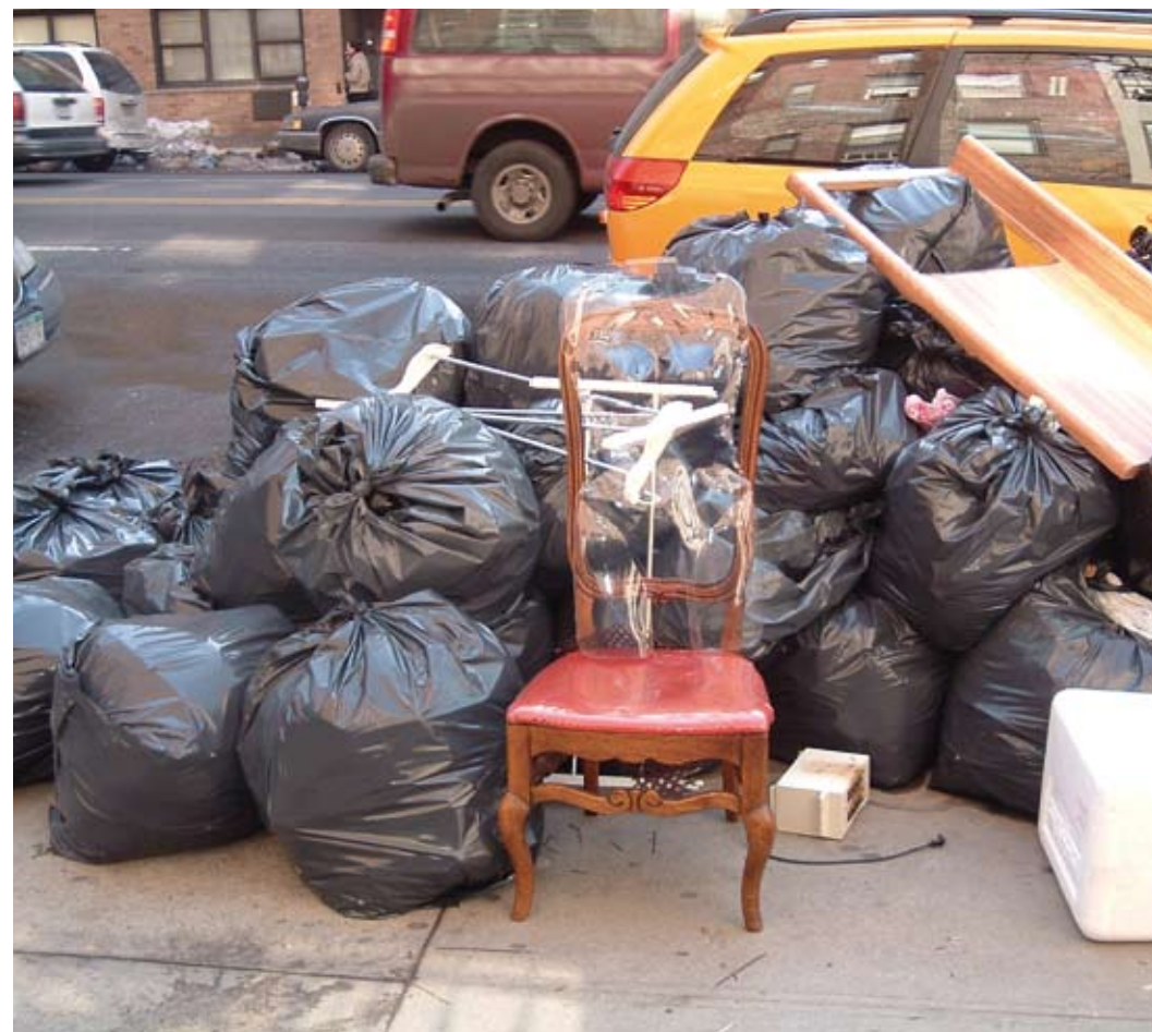
Van de vijf vuilniszakken is er één gevuld met weggegooid voedsel

werk niet meer op dezelfde manier kan doen. Bij biodiversiteit gaat het in de kern om een andere manier van produceren en van consumeren. Daarmee raakt het ook ons persoonlijke leven. Hoe richt je je tuin in? Wat eet je? Weet u dat van vijf vuilniszakken er één gevuld is met etensresten? Voedsel dat wel geproduceerd is, en waarvoor ergens op deze aarde productieruimte is gebruikt, maar dat uiteindelijk gewoon wordt verkwist. Ook daaraan moet een einde komen."