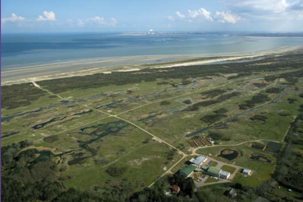
In het duingebied bij Ouddorp wordt drinkwater geproduceerd voor Goeree-Overflakkee