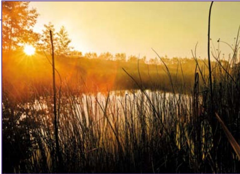
Zonsopgang in het natuurgebied Het Engelse Werk in Zwolle