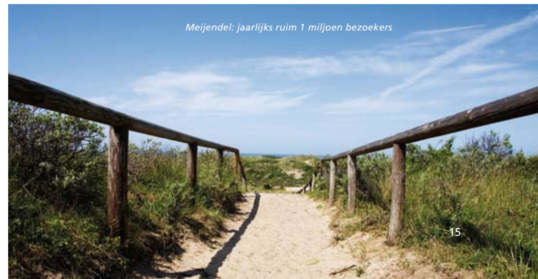
Meijndel: jaarlijks ruim 1 miljoen bezoekers