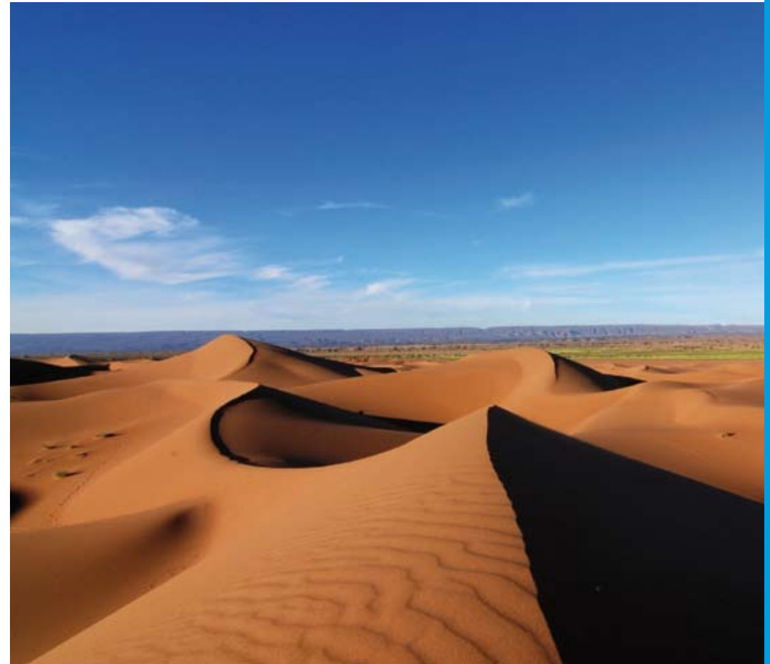
De Sahara was duizenden jaren geleden een nat ecosysteem

"Als soorten dieren of planten verdwijnen, nemen andere soorten hun rol vaak over in een ecosysteem. Maar daaraan zit een