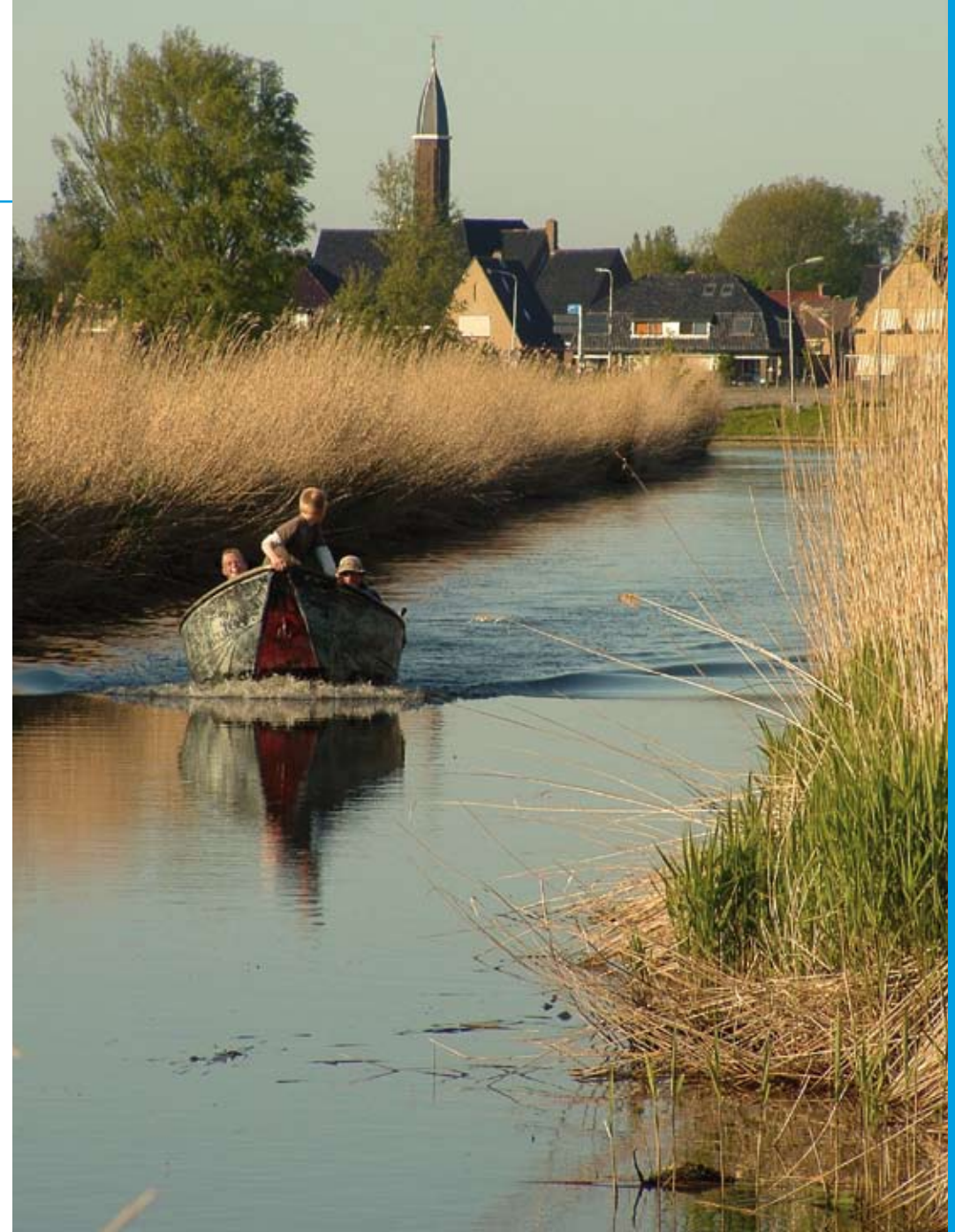
Oevers kun je van hout of beton, maar ook van riet maken

“Persoonlijk vind ik het een belangrijk thema. Terecht dat dit jaar het Jaar van de Biodiversiteit