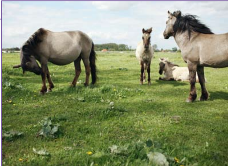
Konikpaarden in Roosteren

'Boeren die we willen ondersteunen, verwelkomen ons niet altijd met koffie en vlaai'