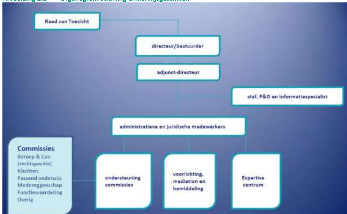
Afbeelding 2.1 Organogram Stichting Onderwijsgeschillen

Bron: Stichting Onderwijsgeschillen, Bestuursverslag 2016