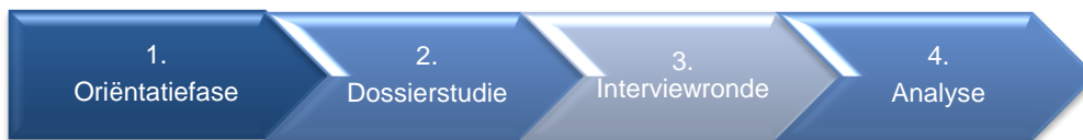
Figuur 1. Fasen in evaluatieonderzoek.

Fase 1 was de oriëntatiefase . Doel van deze fase was het nader uitwerken van de verschillende onderzoeksfasen en het vaststellen van het evaluatiekader. In deze fase zijn verschillende oriënterende gesprekken gevoerd.