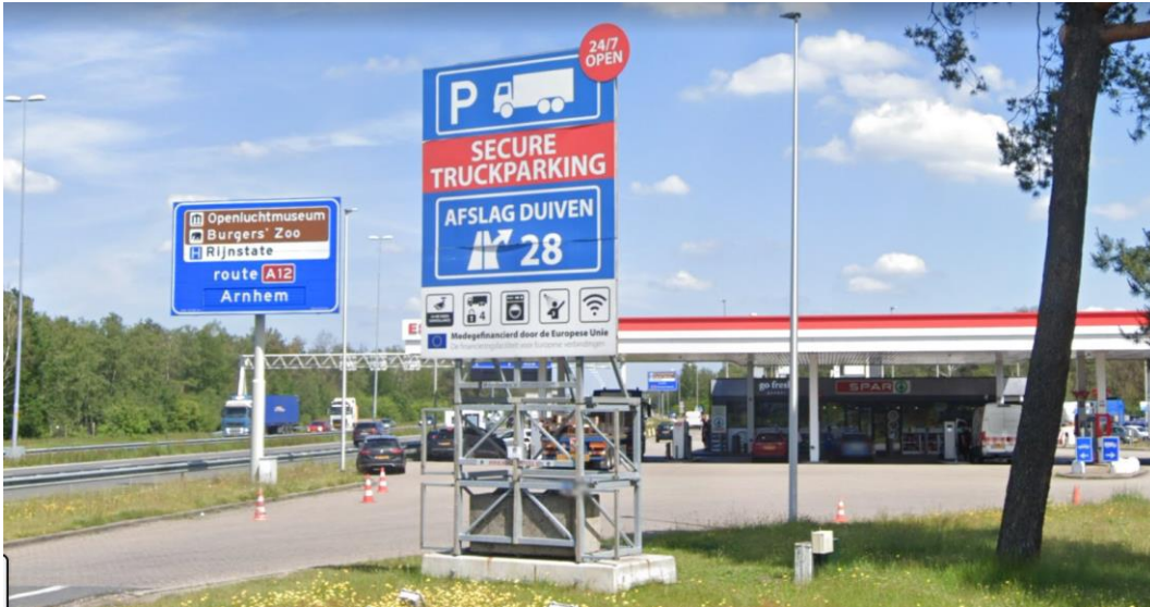
Figuur 6: Informatiebord Truck Parking Duiven op verzorgingsplaats De Slenk

Op de huidige VZP De Slenk is een informatiebord geplaatst door de beheerder van de Truck Parking Duiven (zie Figuur 6).