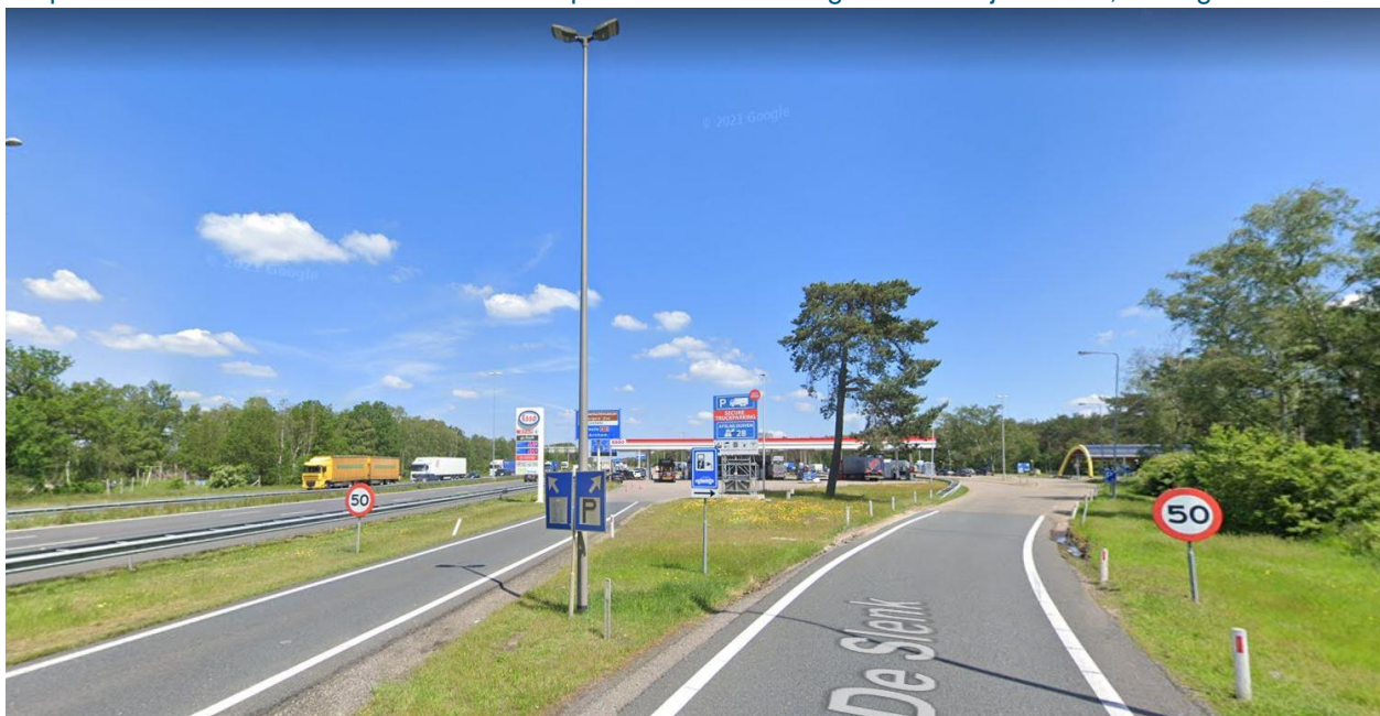
Figuur 1: Verzorgingsplaats De Slenk A50

Dit probleem doet zich onder andere voor op VZP De Slenk langs de A50 bij Arnhem, zie Figuur 1.