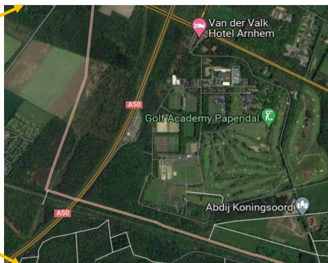
Figuur 4: Detail ligging verzorgingsplaats De Slenk A50