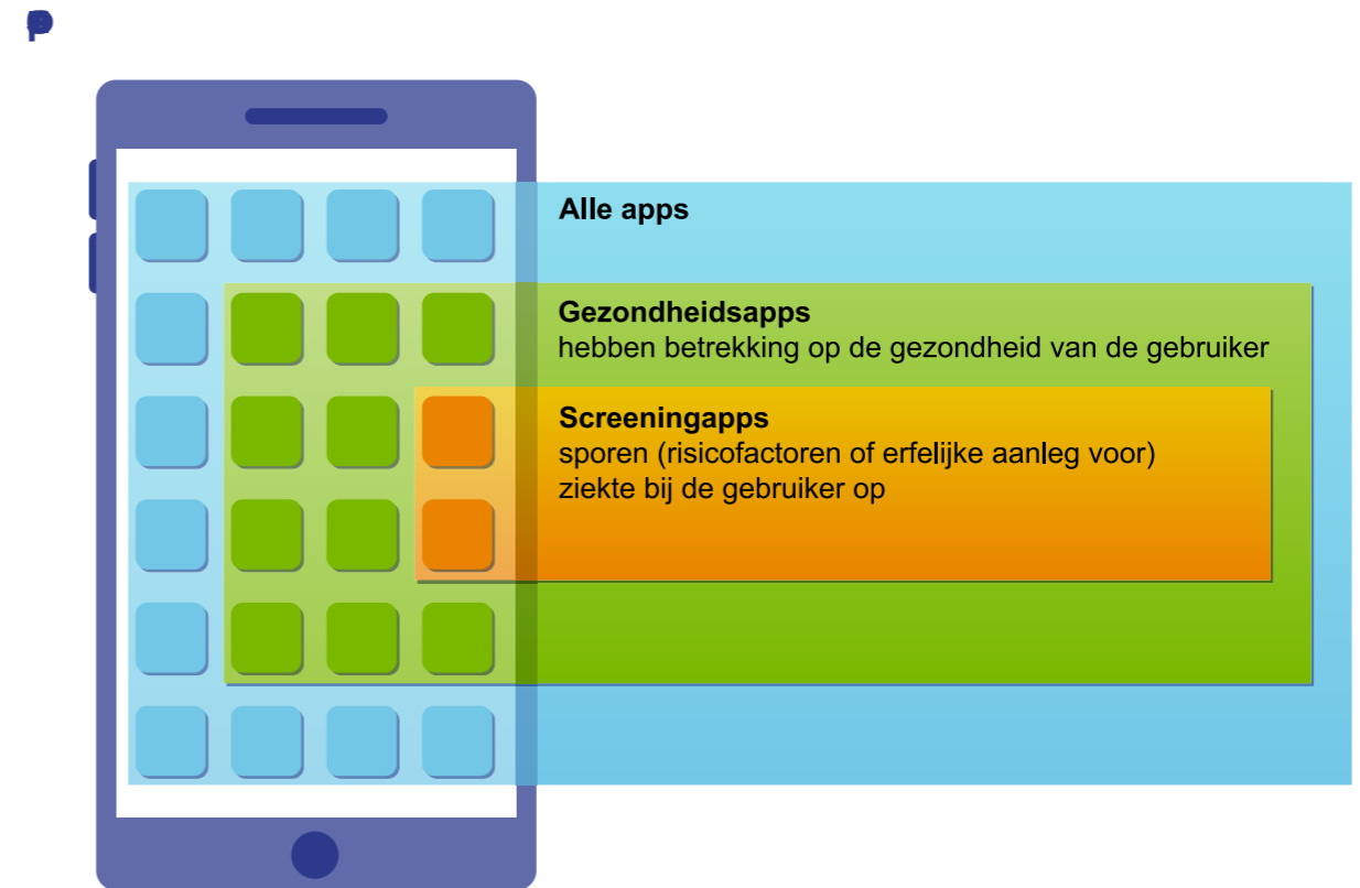
Figuur 2 Reikwijdte advies

Screeningsapps zijn gezondheidsapps die door de overheid worden ingezet om ziekte te voorkomen of vroegtijdig op te