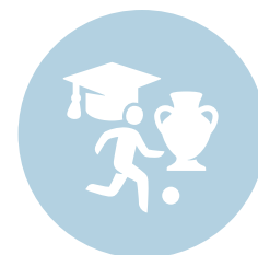
Onderwijs, cultuur, jeugdzaken en sport