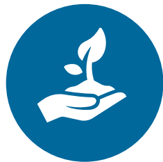
Klimaatverandering en milieu