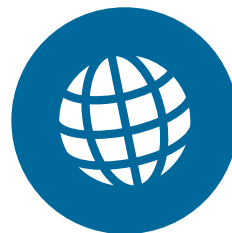
Rol van de EU in de wereld