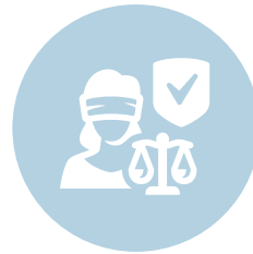
Waarden en rechten, rechtsstaat en veiligheid