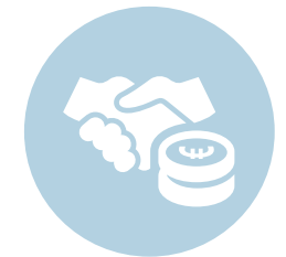
Een sterkere economie, sociale rechtvaardigheid en werkgelegenheid