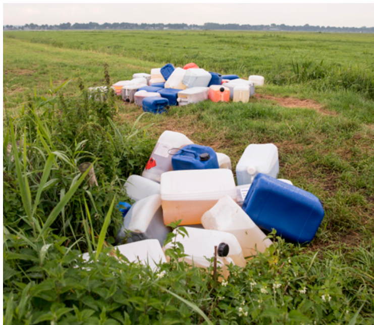
Niet alleen in Noord-Brabant maar ook steeds vaker in Oost-Nederland vinden dumpingen van drugsafval plaats.

Een belangrijke opgave is het voorkomen van drugsafvaldumping. Met de provincies Noord-Brabant en Gelderland wordt door het RIEC bijvoorbeeld afgestemd om te komen tot een gezamenlijke provincie-overschrijdende