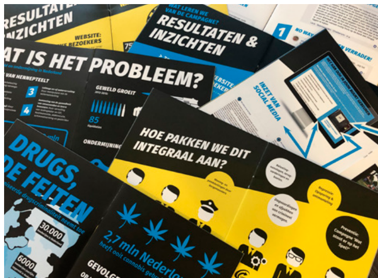
Brochure van de preventiecampagne 'Drugshandel in Limburg: wat staat er op het spel' gericht op bestuurders en raadsleden.

Ook in 2018 is binnen RIEC-LIEC gewerkt aan de aanpak en bestrijding van georganiseerde hennepcriminaliteit. Zo is onder meer stevig ingezet op de aanpak van growshops. In 2018 hebben hiertoe diverse controles plaatsgevonden. Doel is het toezien dat de growshops zich aan de regels houden en niet meewerken aan grootschalige (illegale) hennepcultuur. Doorlopend zijn in 2018 partners ondersteund bij specifieke vragen omtrent drugs(beleid) en casuïstiek. Ook werden er preventiecampagnes en veegweken georganiseerd.