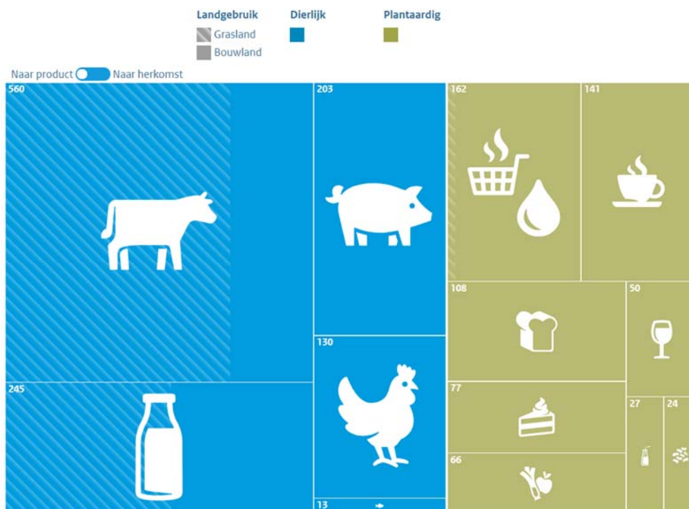
Figuur 1: Indicatieve geografische verdeling landvoetafdruk van de Nederlandse voedselconsumptie. 36

bedraagt: een kwart voetbalveld. Het grootste deel komt voor rekening van de consumptie van dierlijke producten (vlees en zuivel), zoals figuur 1 laat zien.