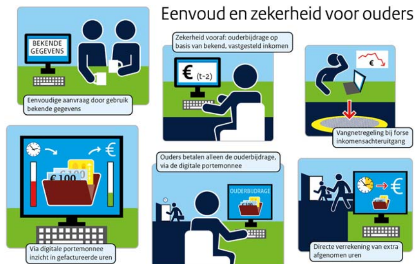
Figuur 1: Nieuwe financieringsstelsel biedt eenvoud en zekerheid voor ouders