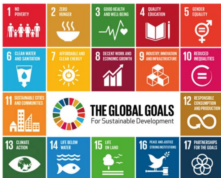
Figuur 2: de SDG's op een rij

De hervormingsagenda van de VN richt zich ook op het VN-ontwikkelingsstelsel. Naast hervorming van de institutionele structuur pleit het Koninkrijk voor een cultuuromslag, gericht op betere samenwerking tussen verschillende actoren. Fragmentatie en overlap tussen de programma's zorgt voor wantrouwen, onnodige concurrentie en een verlies aan focus. Dit gaat ten koste van de efficiëntie en effectiviteit van het VN-ontwikkelingsstelsel. Een centraal element van de SDG's is het principe van Leaving No One Behind (LNOB). Het Koninkrijk wil LNOB centraal stellen in het bredere VN-ontwikkelingsstelsel, door meer focus op de allerarmste en kwetsbaarste mensen en landen.