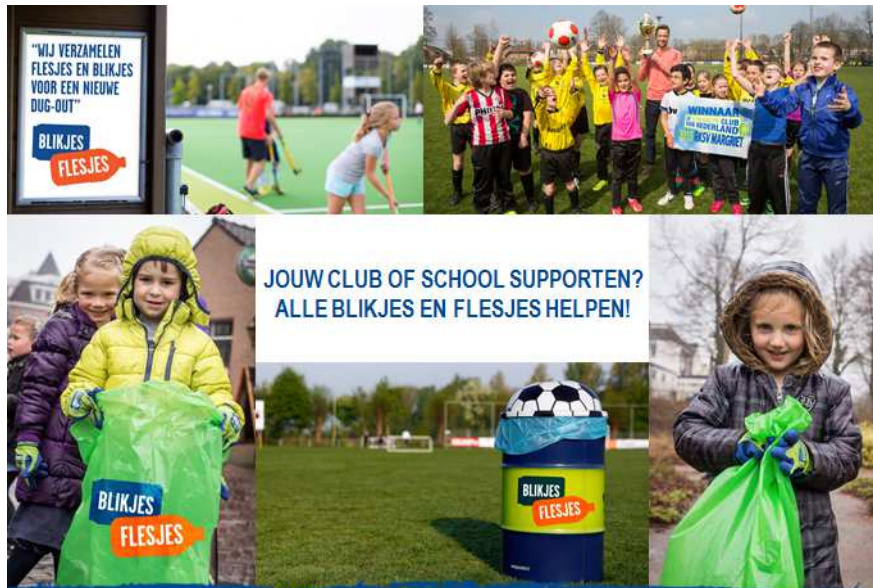
Figuur 4: voorbeelden communicatie op te zetten pilots met scholen en sportverenigingen