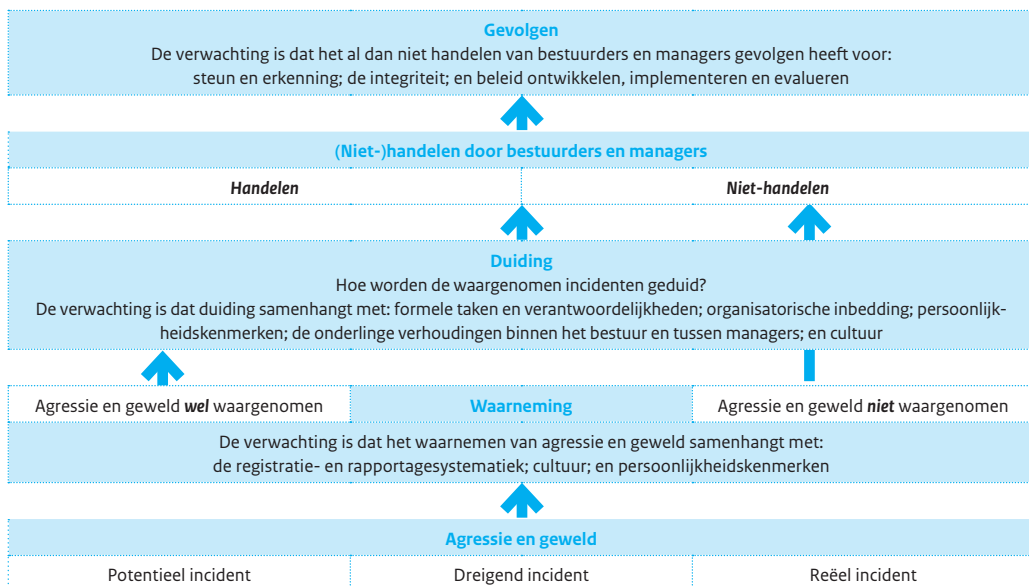
figuur 1: Analyse kader

Het analysekader is een instrument om te beschrijven en begrijpen welke acties bestuurders en managers wel en niet ondernemen. Dit kader presenteert ook de verwachtingen die de onderzoekers hebben op basis van de literatuur en verkennende gesprekken. We lichten eerst kort toe hoe dit kader gelezen kan worden en werken de onderdelen daarna verder uit.