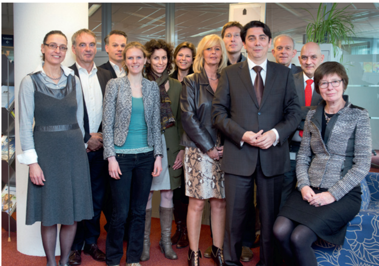
De Transitie Autoriteit Jeugd en medewerkers van het Bureau Transitie Autoriteit Jeugd