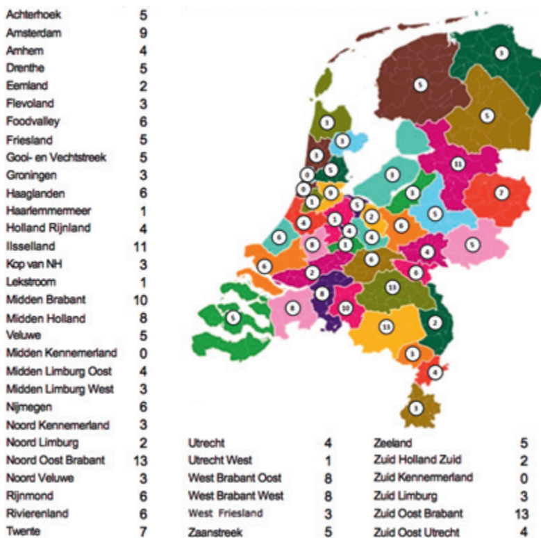
Figuur 2: Aantal keer dat regio bij melding genoemd werd als zorgregio