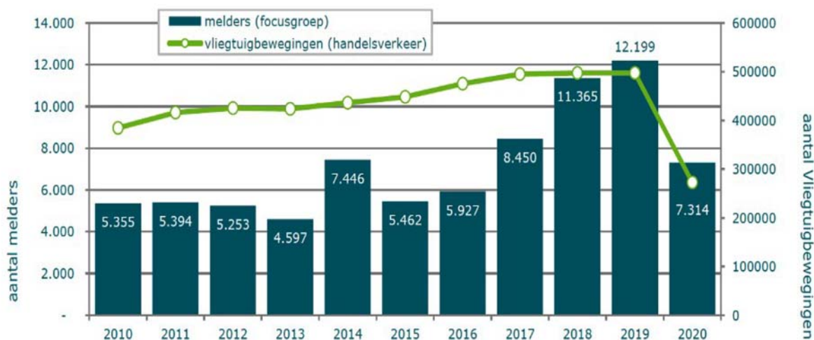
Figuur 1 Aantal melders per jaar (focusgroep)