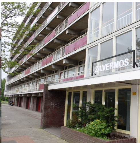
Tijdelijke verhuur in Vianen

Als een woning binnen een paar jaar wordt gesloopt of gerenoveerd kan de woning tijdelijk worden verhuurd. Hiervoor moet een vergunning in het kader van de Leegstandwet worden aangevraagd en die vergunning wordt voor een tijdelijke verhuurperiode van minimaal 6 maanden en maximaal 2 jaar gegeven. Bij vertraging van de sloop- of renovatieplannen kan deze periode soms worden verlengd tot maximaal 7 jaar.