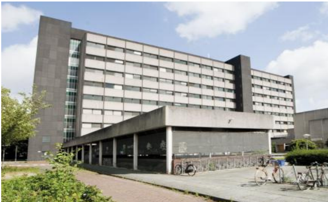
Tijdelijke verhuur in het voormalige Academisch Centrum voor Tandheelkunde in Amsterdam

De leegstand van kantoren is de laatste jaren gegroeid tot een omvangrijk probleem en dit is in 2010 reden geweest om een landelijke kantorentop te organiseren met alle betrokken partijen: gemeenten, provincies, banken, beleggers, projectontwikkelaars en het ministerie van Infrastructuur en Milieu. Op 7 maart 2011 heeft de minister van I&M het Actieprogramma Leegstand Kantoren aan de Tweede Kamer aangeboden. In dat programma wordt de leegstand op drie manieren aangepakt: