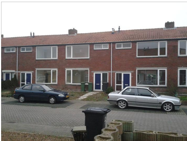
Tijdelijke verhuur in Sint-Maartensdijk