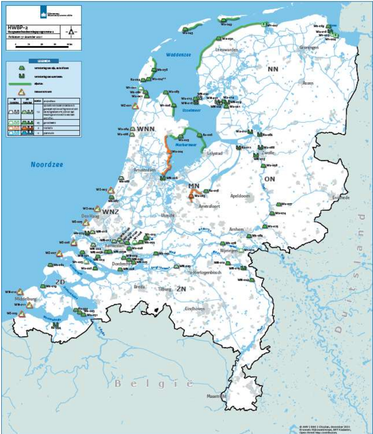
Figuur 2 Actuele scope van het programma, peildatum 31 december 2021