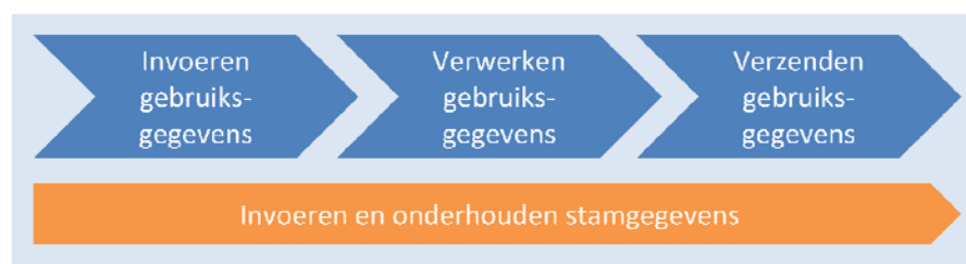
Figuur A Processtappen antibioticumregistratie door dierenarts

Deze processtappen zijn hieronder schematisch weergegeven: