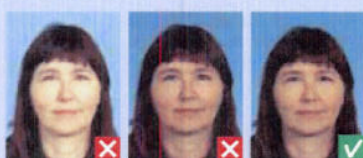
Røde øjne Grynet/pixeleret

Billedet skal være af god kvalitet og uden huller, stempler eller andre skader.