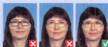
Stel dækker øjne Stel dækker øjne

Øjnene skal være helt fri af stellet og glassene uden toner eller refleksjer