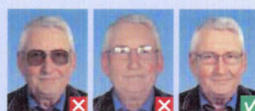
Farvede glas Refleksion i glas