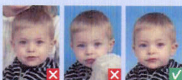
Flere personer Flere motiver