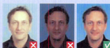
For lyst, skarp blitz For mørkt