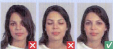
Øje dækket af hår Lukkede øjne

Der må kun være én person på billedet, som skal være taget lige forfra. Baggrunden skal være uden motiver og i ensartet lys farve, f.eks. lys blå eller lys grå. Billedet skal være i farve eller sort/hvid.