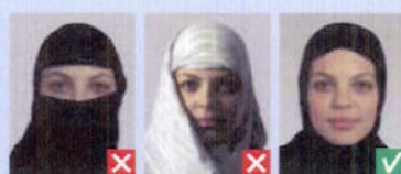
Ansigt dækket Skygger for ansigt

Hovedbeklædning tillades kun af religiøse grunde. Pande, hageparti og kindben skal være synlige.