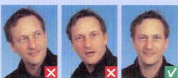
Kigger væk Hoved skævt Ikke lige forfra Åben mund

Blikket skal være rettet mod kameraet, øjnene helt synlige og munden lukket.