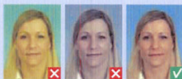
Unaturlige farvetoner Udvaskede farver

Billeder af personer med hvidt/lyst hår og personer med lyst tørklæde skal have en baggrund i skarp kontrast.