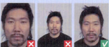
For tæt på For langt væk

Blikket skal være rettet mod kameraet, øjnene helt synlige og munden lukket.