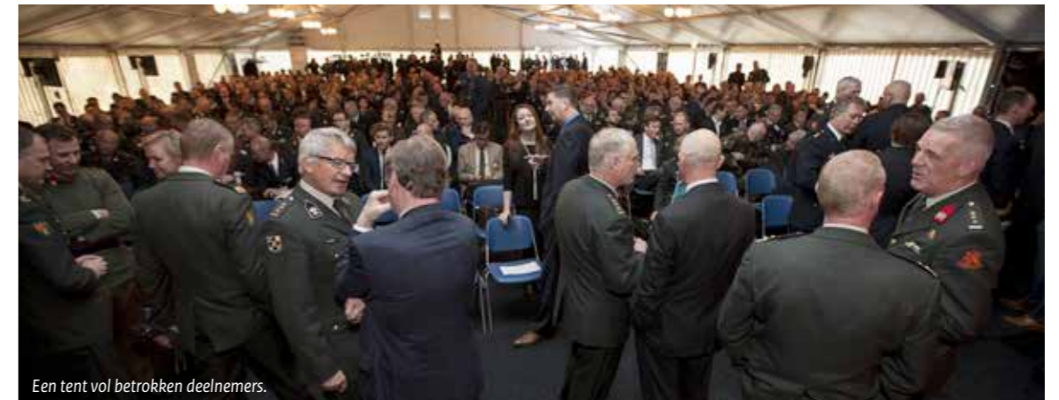
Een tent vol betrokken deelnemers.