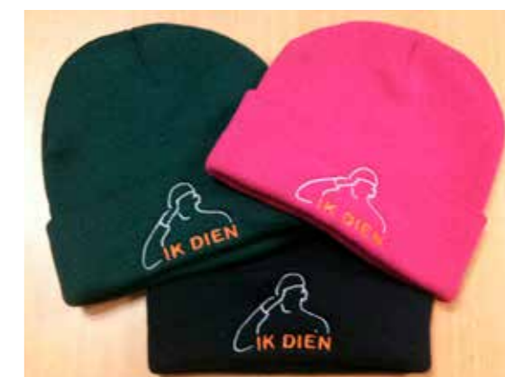
Een warm geschenk na afloop voor alle deelnemers

Het zou mooi zijn als mensen in Nederland over een aantal jaar niet alleen weten wat een reservist is maar dat velen een reservist kennen. En hopelijk zullen ook steeds meer mensen met gepaste trots zeggen: “Ik dien”.