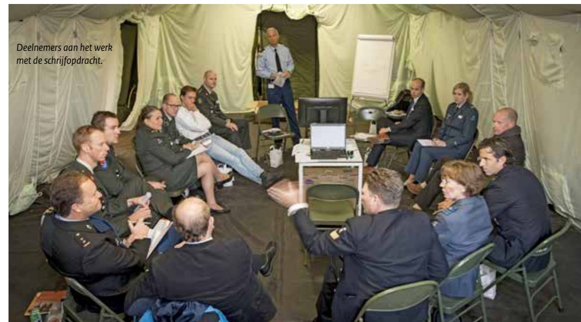
Deelnemers aan het werk met de schrijfpdracht.

Een korte film liet reservisten en werkgevers aan het woord over hun motivatie om zich voor Defensie in te zetten en hun ambitie voor de toekomst. Rode draad hierin was het besef dat het werk van de krijgsmacht belangrijk is voor ons land en dat eenieder op zijn eigen manier hier een bijdrage aan kan leveren.