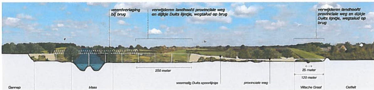
2 Doorlatend maken landhoofd (2 openingen) en weerdverlaging, uitzicht vanaf Veerstoep naar het zuiden