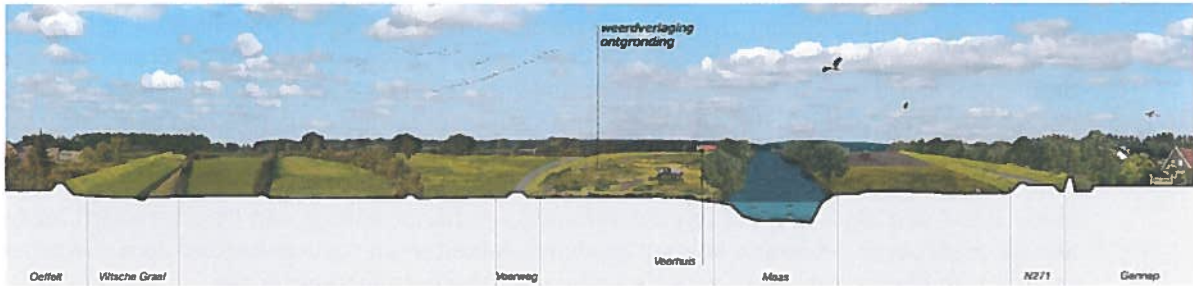
1 Weerdverlaging, uitzicht vanaf Provinciale weg naar het noorden