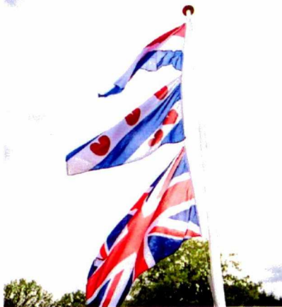
Trije flaggen oan 'e mêst foar in nije trijetalige skoalle.