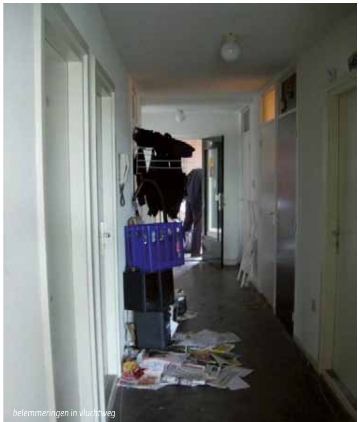
belemmeringen in vluchtweg

In een aantal onderzochte panden komen geisers, gaskachels voor die voor de verbranding lucht nodig hebben uit de ruimte waarin ze zich bevinden. In het merendeel van de situaties is de ventilatie van die ruimten niet of nauwelijks aanwezig. Ook de onderhoudstoestand van deze apparaten laat te wensen over en daarmee bestaat de kans voor onvolledige verbranding. Het gevaar voor koolmonoxidevergiftiging ligt daarmee op de loer.