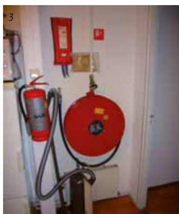
1: verstopte brandslanghaspel