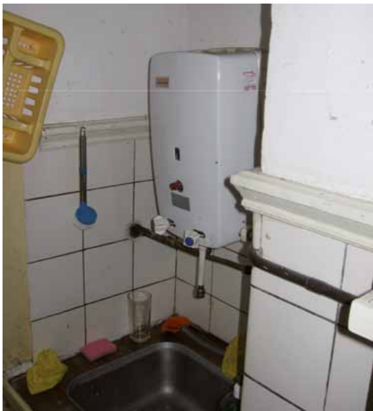
Geiser (open verbrandingstoestel)