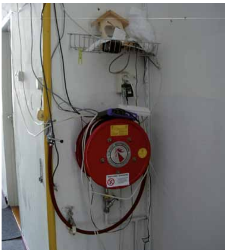
Wirwar elektrische installatie