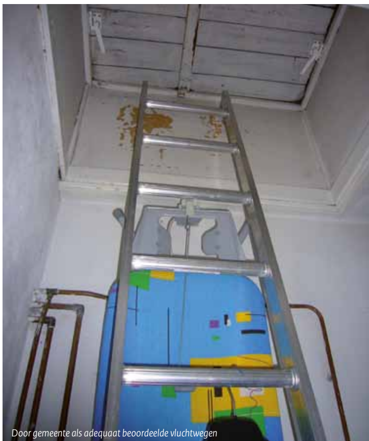
Door gemeente als adequaat beoordeelde vluchtwegen