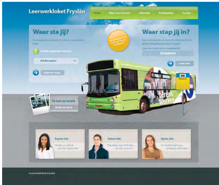
Website 'Leerwerkloket Fryslân'

Marit Wagenmakers, beleidsmedewerker van de gemeente Leeuwarden, benadrukt het belang van goede communicatie. “Aanvankelijk was er niet veel aanloop in de bus. We plaatsten een advertentie in de huis-aan-huis bladen en gingen dan met de bus ergens naar toe. Dat werkte niet.” Aan het