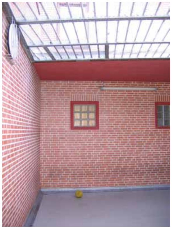
Luchtplaats met ontsnappingsluik

In politiebureau's waar tekortkomingen met de brandcom- partimentering zijn geconstateerd, was de rookcomparti- mentering meestal ook niet op orde.