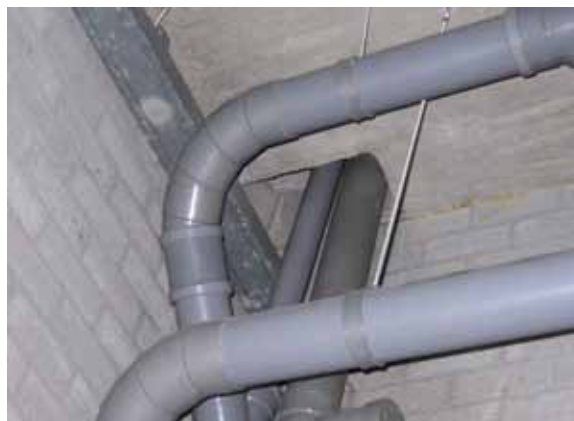
Niet brandwerend afgewerkte doorvoer naar cellencomplex

De geconstateerde gebreken ten aanzien van de subbrandcompartimentering van de cellen deden zich zowel voor bij ophoudruimten in kleinere politiebureau's als in de grotere bureau's met cellencomplexen.