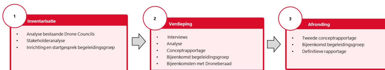
Figuur 1. De aanpak van de verkenning

Deze verkenning en ons advies is tot stand gekomen door een bureaustudie en verdiepende stakeholderinterviews (zie figuur 1 voor de verschillende fases van de verkenning). De bureaustudie is uitgevoerd naar het speelveld in Nederland en samenwerkingsverbanden rondom drones in andere landen. In een verdiepende fase hebben gebruik gemaakt van inbreng van verschillende partijen uit de sector gedurende een traject van drie maanden. Hiervoor hebben wij 14 interviews afgenomen met partijen. De resultaten van de verkenning zijn voorgelegd aan een begeleidingsgroep die de breedte van het speelveld vertegenwoordigt. 2