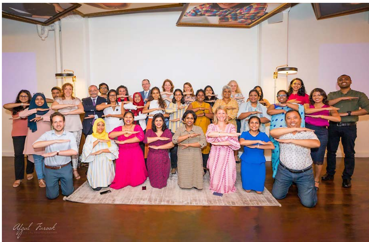
Tijdens Internationale Vrouwendag organiseerde de ambassade in Sri Lanka SPEAKUP! Talks, waarbij de kracht van storytelling centraal stond. Deelnemers konden hier in een veilige omgeving hun ervaringen uitwisselen en leerden over het doorbreken van taboes.

viering van 16 Days of Activism Against Gender-Based Violence . Een op de drie vrouwen in Zimbabwe krijgt te maken met seksueel of gender-gerelateerd geweld. In samenwerking met lokale organisaties werd de inzet geëerd van 16 vrouwen, mannen en instituties voor de bescherming van de rechten van vrouwen en meisjes in Zimbabwe. Zogenaamde 'gender kampioenen' werden gekozen uit meer dan 200 kandidaten uit het hele land. De ambassade toonde op sociale media 16 dagen lang het inspirerende werk van deze voorvechters van vrouwenrechten. Voorts steunde de ambassade ieder van de kampioenen met een beurs van USD 5.000 om hun belangrijke werk uit te breiden. Daarmee kunnen zij in samenwerking met lokale gemeenschappen de strijd verder aanbinden met gender-gerelateerd geweld, kindhuwelijken voorkomen, en de autonomie van vrouwen