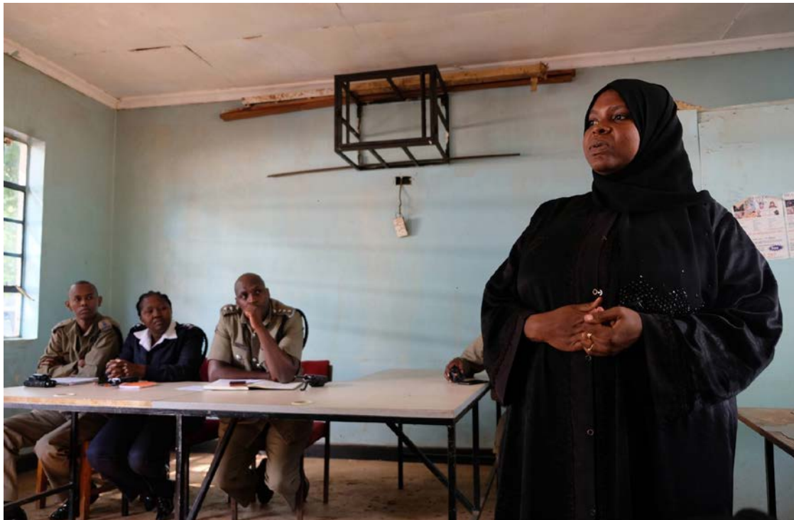
Vrouwen, jongeren, religieus leiders en lokale politie in dialoog in Kwale, Kenia, om onderling vertrouwen tussen christenen en moslims te stimuleren en veiligheid te vergroten.

Om radicalisering tegen te gaan en interreligieuze tolerantie te stimuleren, is onder andere het Women of Faith Network – bestaande uit een zestigtal vrouwelijke religieus leiders van verschillende religieuze instanties – opgericht. Naast preventie van radicalisering is dit netwerk actief op het terrein van religie en vrouwenrechten. Zo spreken ze onder andere op lokale radiostations om bewustwording over deze thema's te vergroten. Met Nederlandse steun werkt Mensen met een Missie samen met deze lokale leiders en partners om wederzijds begrip te creëren en op de lange termijn bij te dragen aan mensenrechten, vrede en veiligheid in plekken zoals Mombassa.