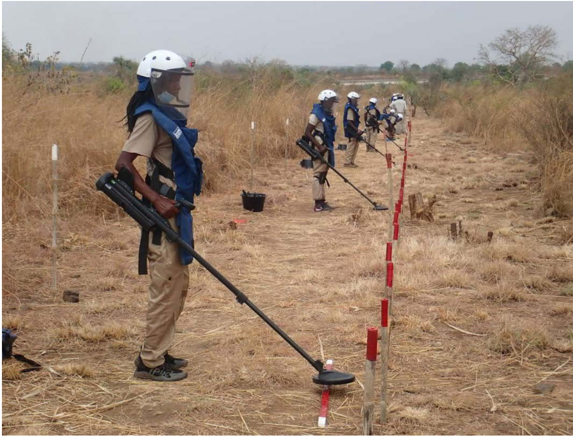
Vrouwen in Zuid-Soedan leren ontminnen. In 2020 werkte Nederland samen met partners MAG, DCA en DDG die mijnen ruimden en slachtoffers hielpen hun leven weer op te pakken. Zo worden gebieden weer leefbaar gemaakt voor burgers.