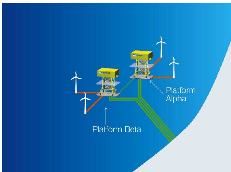
Figuur 2 Schematische weergave van concept van een net op zee.

Het uitgangspunt voor de opgave voor windenergie op zee is om de windparken op de meest kosteneffectieve wijze te realiseren. Dit gebeurt door uit te gaan van een nieuw concept van TenneT voor het net op zee 16 . Dit concept maakt gebruik van standaardplatforms, waarop per platform 700 MW windenergiecapaciteit kan worden aangesloten. Op het platform worden de windturbines van de windparken aangesloten, zie figuur 2. TenneT combineert twee windparken (van elk circa 350 MW) op een platform.