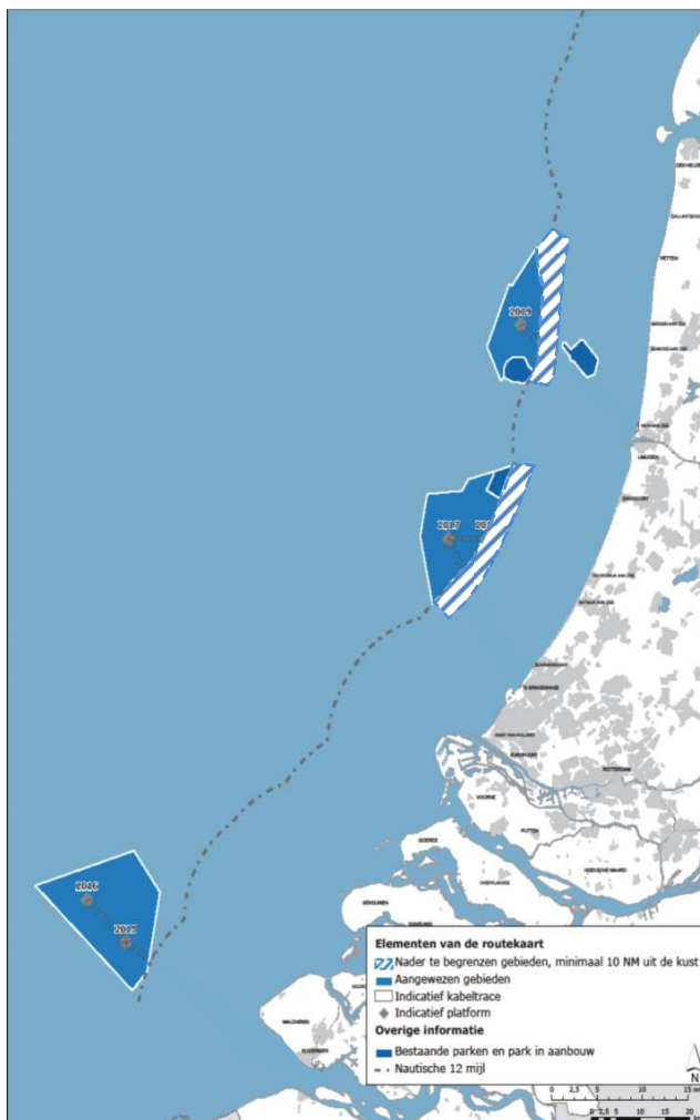
Figuur 1 Windenergiegebieden waarop dit ontwikkelkader betrekking heeft. De gearceerde gebieden moeten nog worden aangewezen.

Tijdens de evaluatie van de vorige uitgifteronde van windenergie op zee is de conclusie getrokken dat het kostenvoordelen biedt wanneer de uitrol van windenergie op zee geclusterd en onder regie van de rijksoverheid zal plaatsvinden 8 . Dit is onderkend bij het maken van afspraken in het Energieakkoord. Concreet betekent dit dat de uitrol zal plaatsvinden in clusters per windenergiegebied dat is aangewezen in het nationaal waterplan. In elk windenergiegebied zullen vervolgens kavels worden vastgesteld. De vergunningen en subsidie worden uitgegeven via een tenderprocedure.