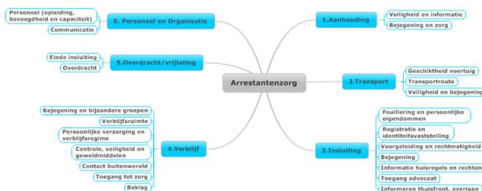
Figuur 2: Overzicht proces arrestantenzorg en deelaspecten

Aan de hand van interviews, dossier- en documentenstudies en observaties zijn de Inspecties nagegaan hoe de politie uitvoering geeft aan arrestantenzorg. Per eenheid hebben de Inspecties gesproken met de volgende respondenten: