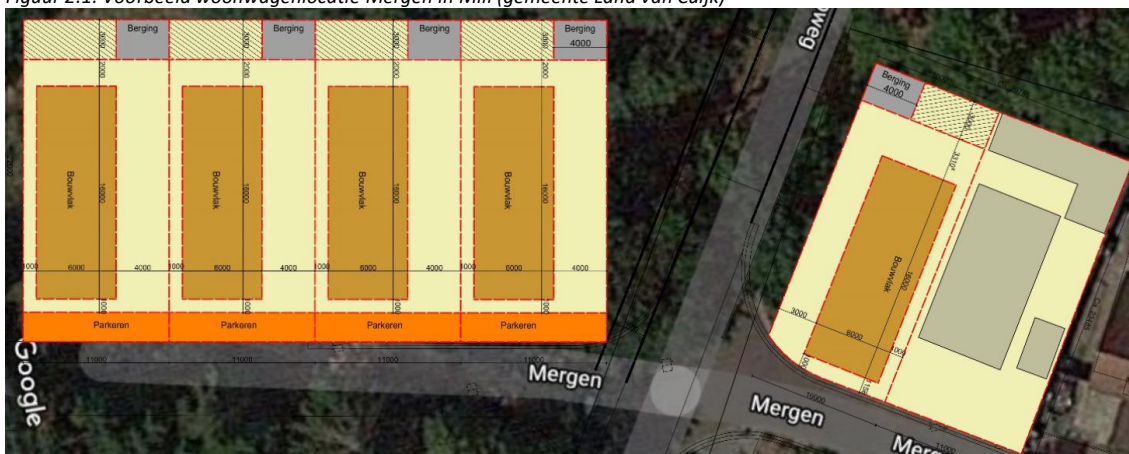
Figuur 2.1: Voorbeeld woonwagenlocatie Mergen in Mill (gemeente Land van Cuijk)