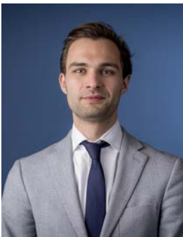
Maarten van Ooijen, Staatssecretaris Volksgezondheid, Welzijn en Sport, Coördinerend bewindspersoon Nationaal Actieplan Dakloosheid