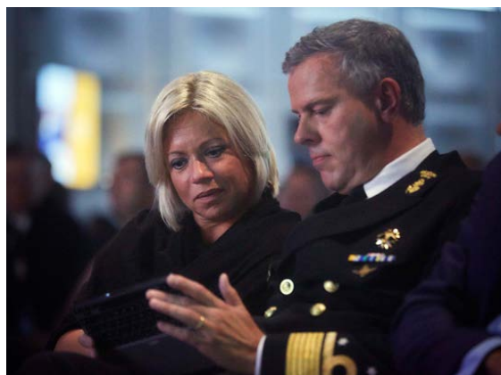
De minister en de PCDS bekijken vragen op Buzzmaster