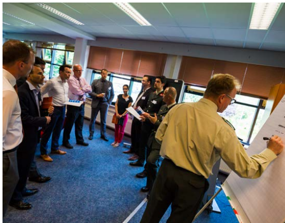
Deelnemers bij de werkopdracht

Na deze presentaties introduceerde de dagvoorzitter de werkopdracht. De deelnemers gingen uiteen in 28 werkgroepen van wisselende samenstelling om zich te buigen over mogelijke vormen van samenwerking tussen Defensie en de civiele maatschappij. Drie concrete voorstellen m.b.t. competentieontwikkeling, een logistiek netwerk en het z.g. Alliantieloket werden na afloop van de werkopdracht plenair aan de Plaatsvervangend Commandant der Strijdkrachten gepresenteerd. De dagvoorzitter benadrukte hierbij dat alle overige plannen op een later moment op haalbaarheid worden getoetst.