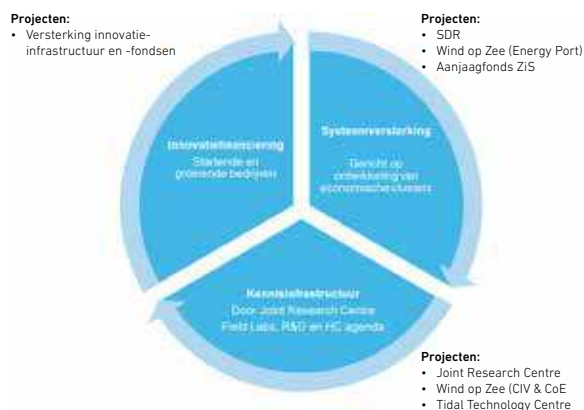
Figuur 1 Drie elementen van structuurversteviging

In de tabel op bladzijde 7 is beknopt de stand van zaken per actielijn weergegeven.