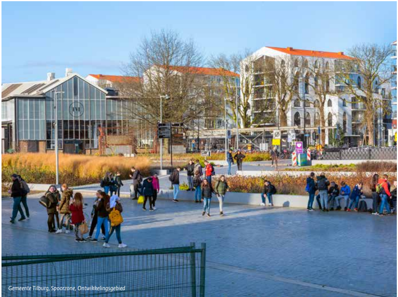
Gemeente Tilburg, Spoorzone, Ontwikkelingsgebied