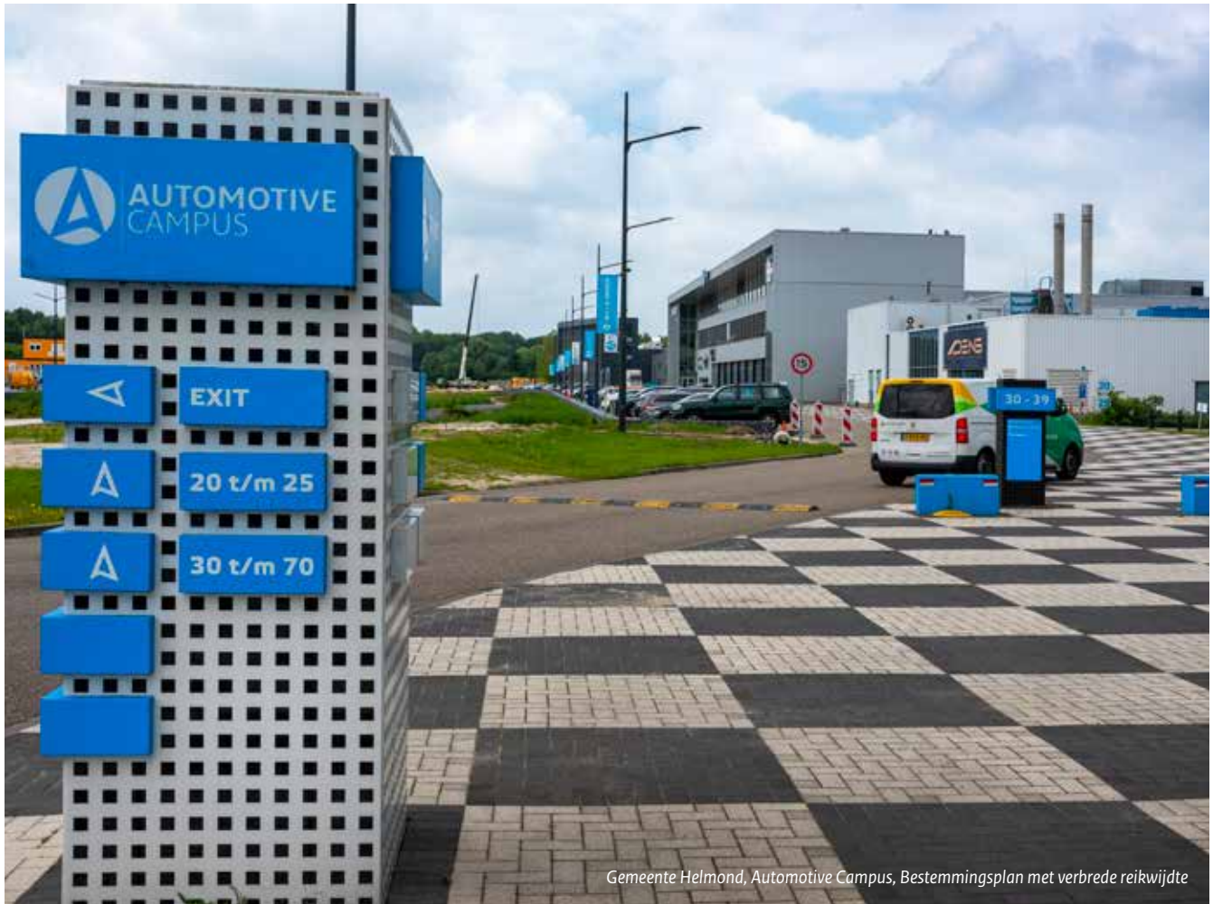
Gemeente Helmond, Automotive Campus, Bestemmingsplan met verbrede reikwijdte