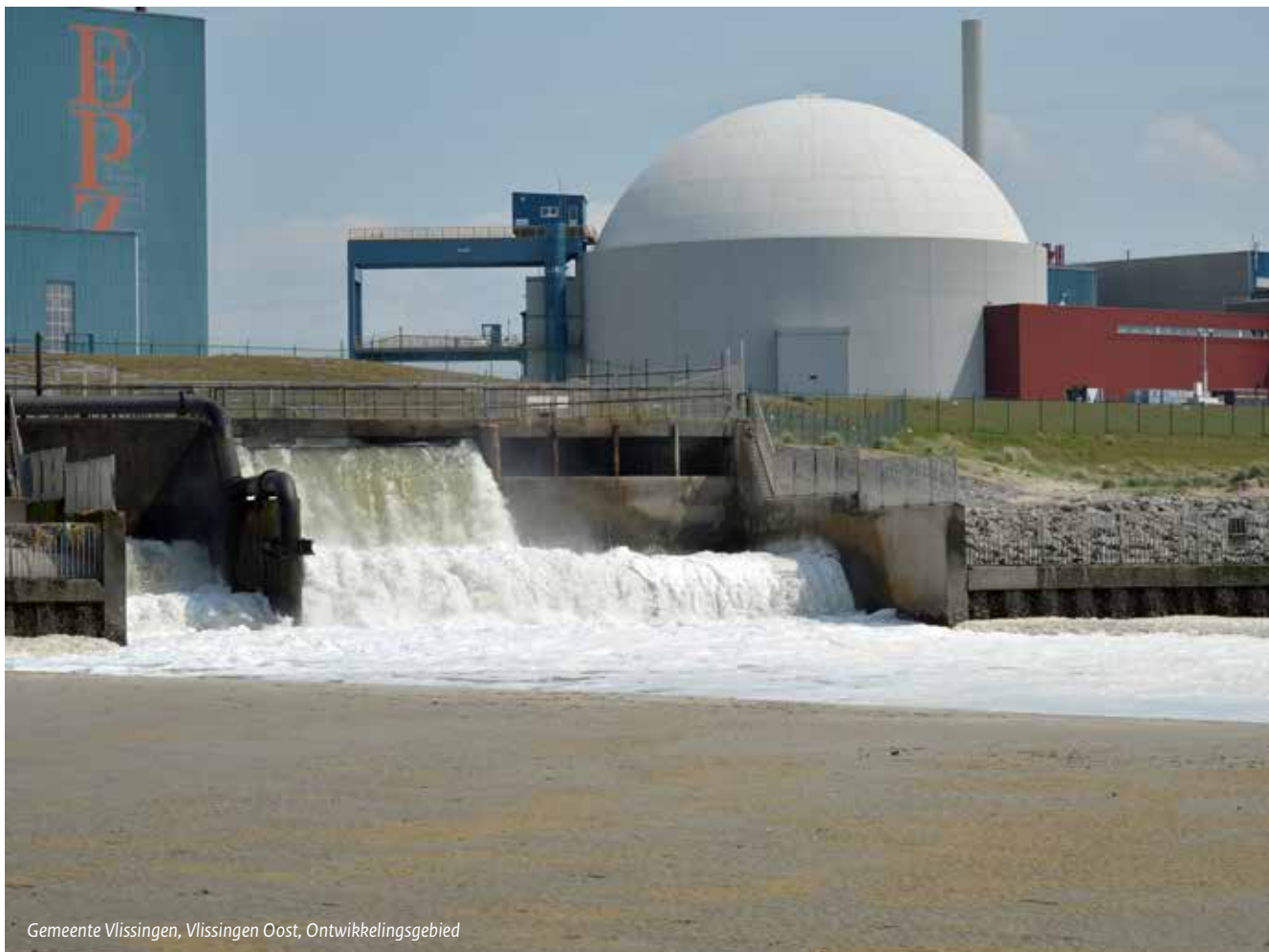
Gemeente Vlissingen, Vlissingen Oost, Ontwikkelingsgebied

Waar dat zinvol is worden in dit hoofdstuk wel specifieke punten van het ontwikkelingsgebied benoemd. Ook is aan het slot van dit hoofdstuk het Transformatiegebied Noordpoort in Meppel toegelicht, waarin beide instrumenten (verbrede reikwijdte én ontwikkelingsgebied) worden ingezet voor de transitieopgave.