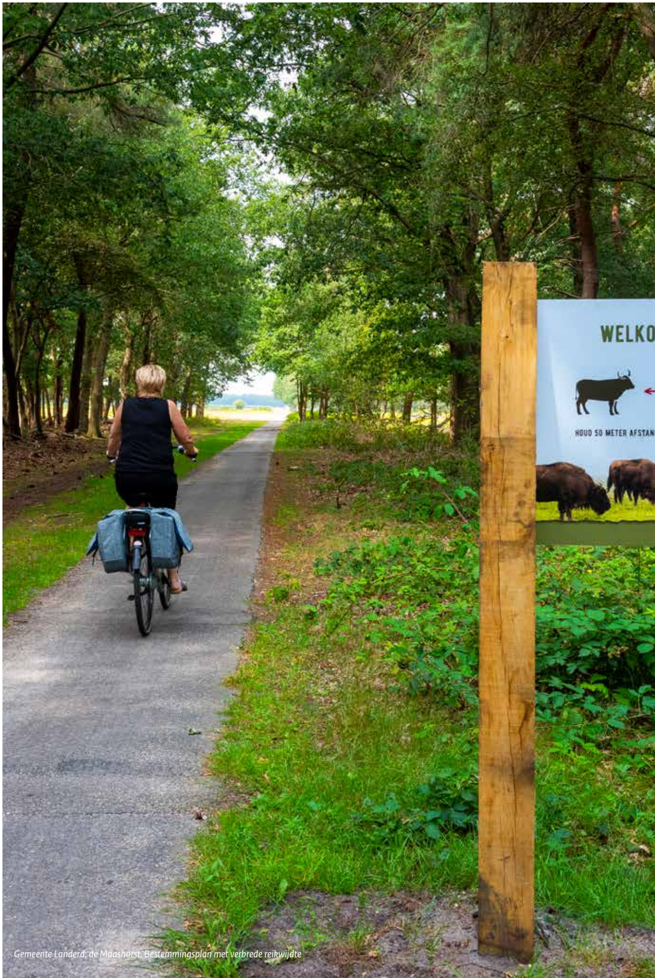
Gemeente Landerd, de Maashorst, Bestemmingsplan met verbrede reikwijdte