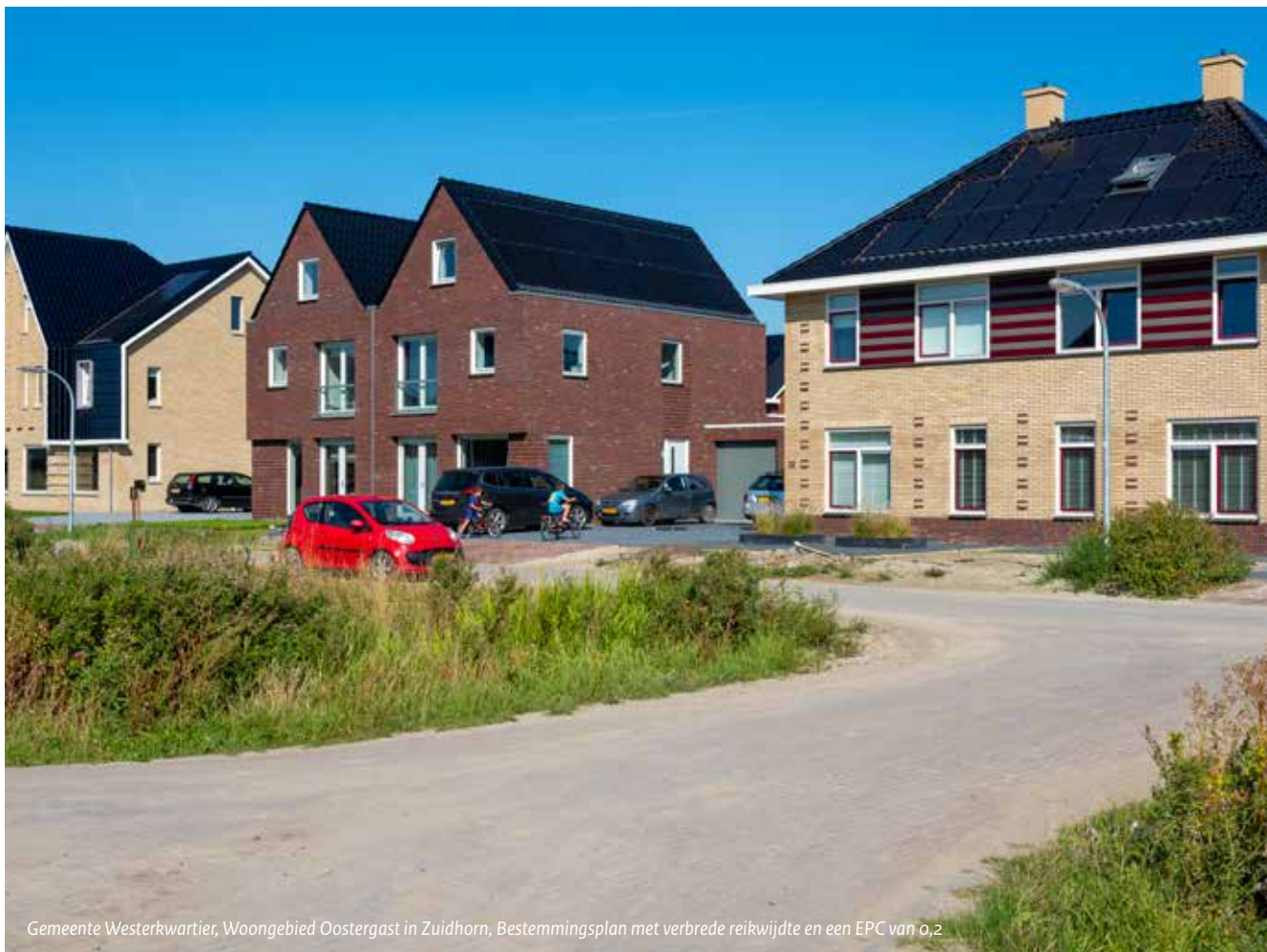
Gemeente Westerkwartier, Woongebied Oostergast in Zuidhorn, Bestemmingsplan met verbrede reikwijdte en een EPC van 0,2

behaalt goede resultaten. Bij hoogbouw blijkt het soms lastig om te voldoen aan de 1 e traps-eis, dat EPC zonder gebiedsmaatregelen moet worden gehaald. Voor de Binckhorst in Den Haag blijkt de verlaagde EPC-norm een goede ingang om met initiatiefnemers in gesprek te gaan over de oplossingen die de gemeente voorstaat voor energie en warmte. De EPC-norm is echter niet voldoende, de gemeente bereid aanvullende plan- of beleidsregels voor om de gewenste oplossingen af te dwingen.