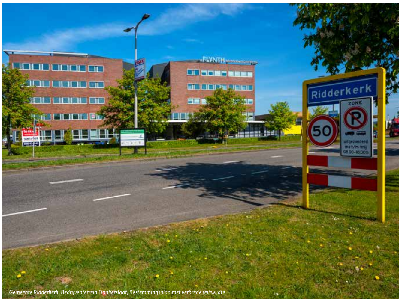
Gemeente Ridderkerk, Bedrijventerrein Donkersloot, Bestemmingsplan met verbrede reikwijdte