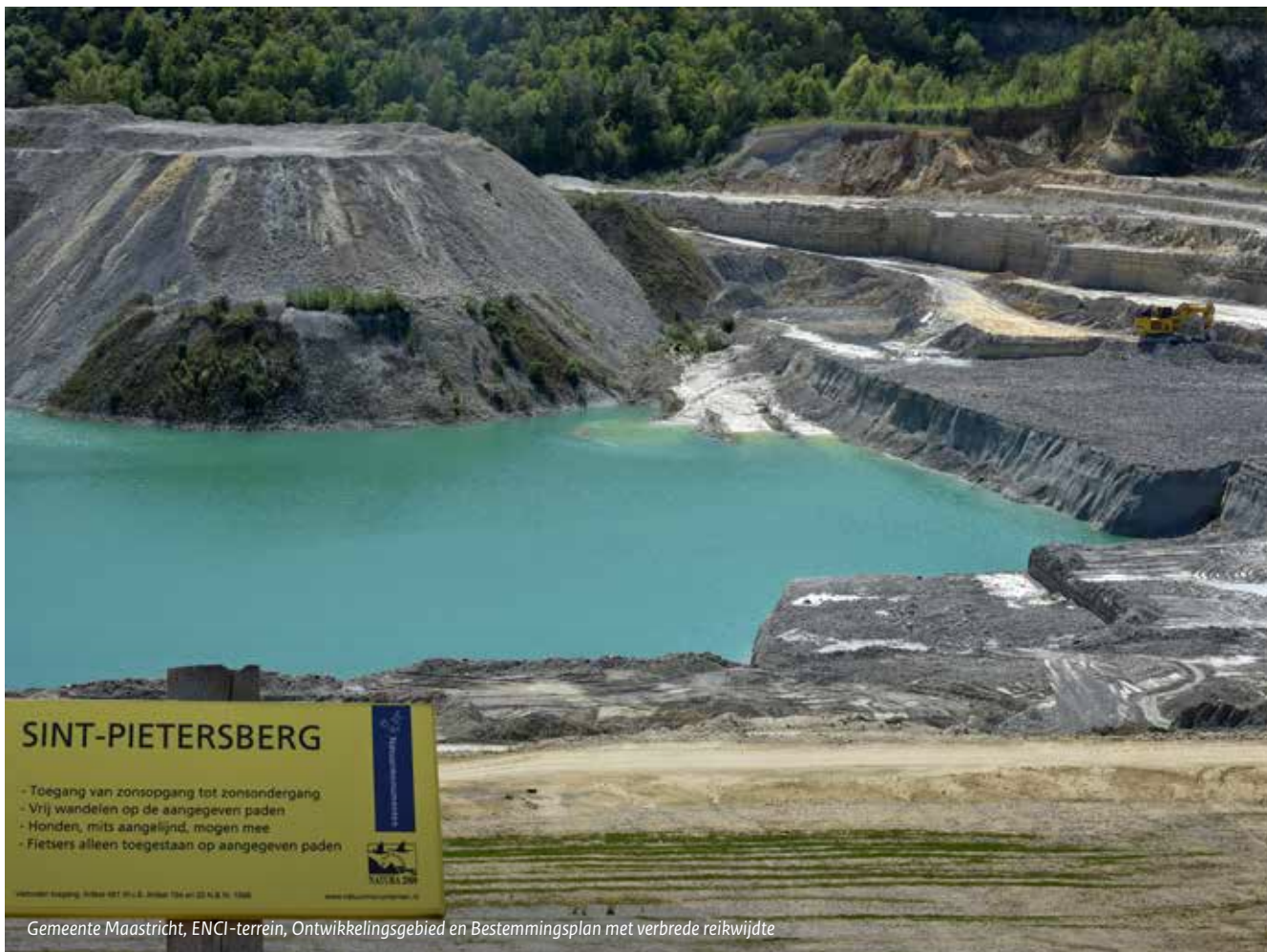
Gemeente Maastricht, ENCI-terrein, Ontwikkelingsgebied en Bestemmingsplan met verbrede reikwijdte

De Chw maakt het mengpaneel van Transformatiegebied Noordpoort op een paar manieren mogelijk. De schuifjes van het mengpaneel gaan over meer dan alleen een goede ruimtelijke ordening. De verbrede reikwijdte van het experiment maakt ook een schuifje voor bijvoorbeeld leefbaarheid en duurzame werkgelegenheid mogelijk. De tweede hulp van de Chw gaat over de koppeling van het mengpaneel aan het verlenen van toestemming voor een activiteit. Voor de invulling van een deelgebied is een omgevingsvergunning nodig voor een bestemmingsplanactiviteit. De bestemmingsplanactiviteit maakt onderdeel uit van het Chw-experiment. De omgevingsvergunning wordt alleen verleend als voldoende schuifjes uit het mengpaneel goed staan (en tenminste neutraal scoren). Verder is bij de invulling van het mengpaneel gebruik gemaakt van beleidsregels, die gekoppeld zijn aan een open norm in het plan.