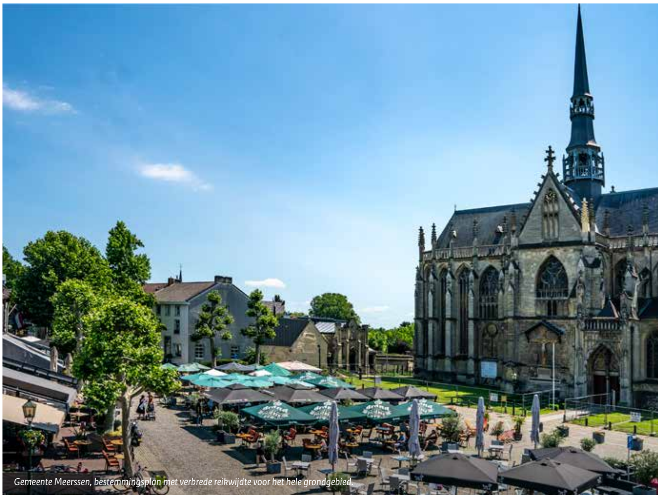
Gemeente Meerssen, bestemmingsplan met verbrede reikwijdte voor het hele grondgebied.