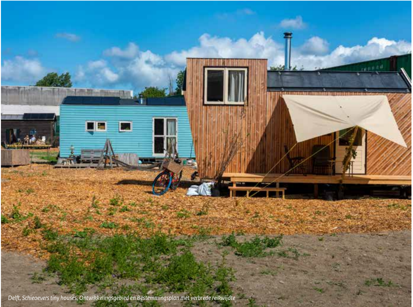
Delft, Schieoevers tiny houses, Ontwikkelingsgebied en Bestemmingsplan met verbrede reikwijdte