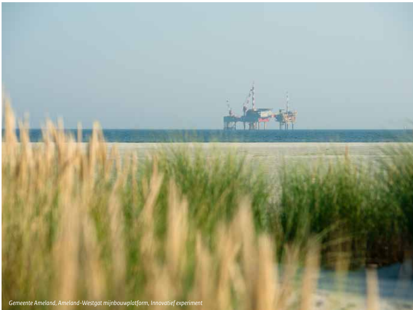
Gemeente Ameland, Ameland-Westgat mijnbouwplatform, Innovatief experiment