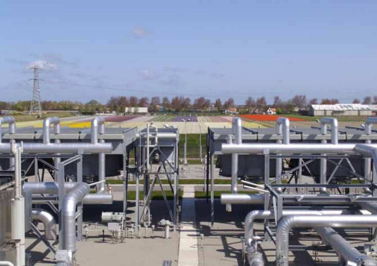
Productie van Nederlands gas