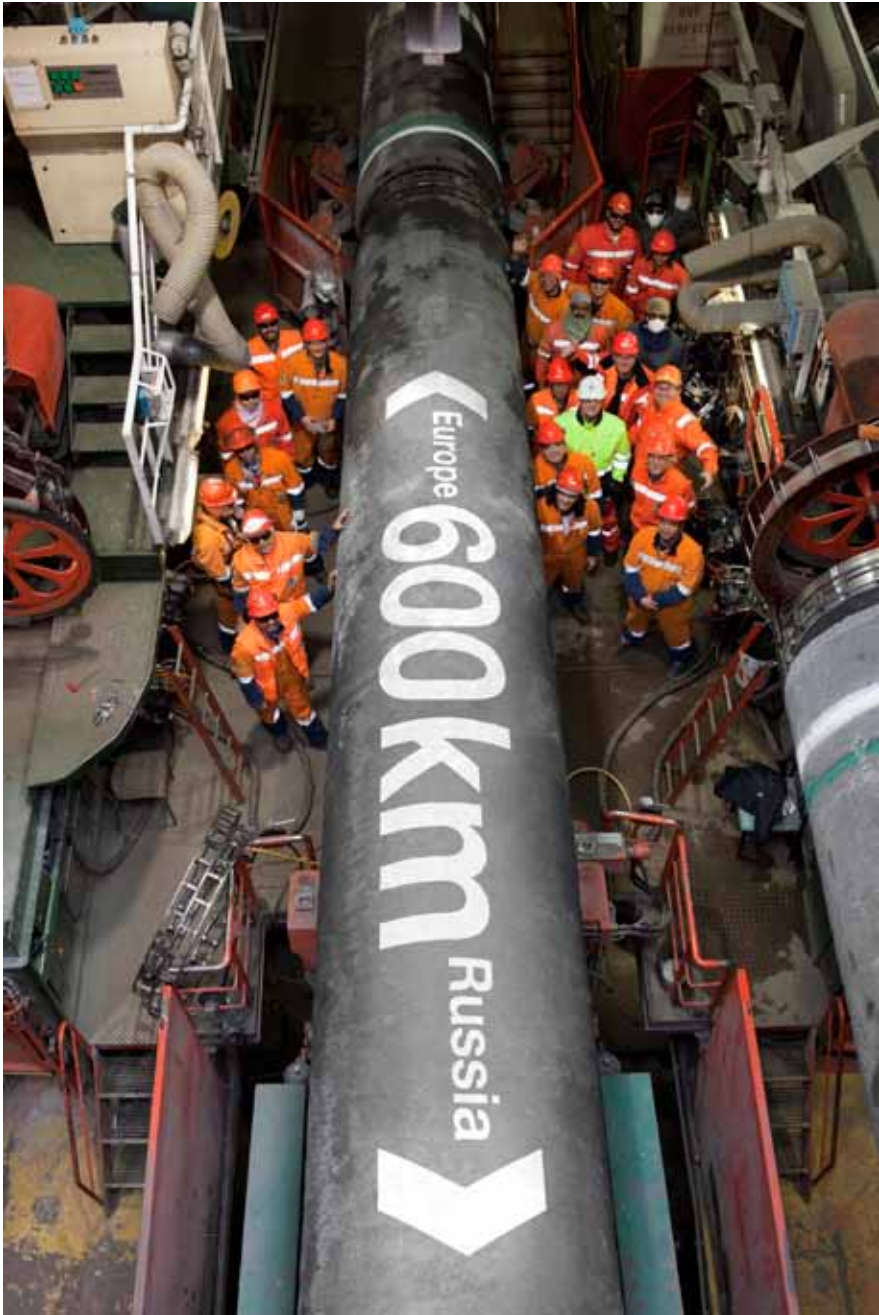
Het midden van de 1200 km lange Nord Stream-pijpleiding