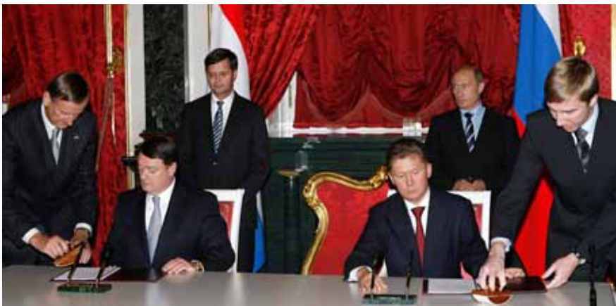
Ondertekening van gasinfrastructuurcontract in aanwezigheid van Nederlandse en Russische bewindslieden.

Met name de minister-president blijkt tijdens bezoeken en gesprekken, met verschillende Russische counterparts, een veelheid aan thema's te kunnen bespreken; energie, Europese en internationale politiek, mensenrechten. Het opbrengen van onderwerpen op het gebied van mensenrechten en goed bestuur door de minister van EL&I, namens de minister-president, tijdens de ingebruikname van Sachalin II, werd van Russische zijde niet op prijs gesteld.