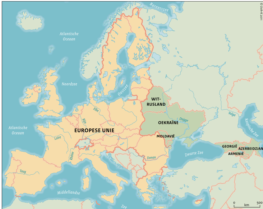
De Europese Unie en het Oostelijk Partnerschap

BZ participeert structureel in de energiewerkgroep van het Oostelijk Partnerschap waaraan deelgenomen wordt door Moldavië, Georgië, Armenië, Azerbeidzjan, Oekraïne en Wit-Rusland. Met deze landen wordt onder leiding van de Europese Commissie en alle 27 lidstaten gesproken over energievoorzieningszekerheid, in het bijzonder energie infrastructuur ( Nabucco , South Stream ), energie efficiency en transparantie van beleid en regelgeving ( Energy Charter ). 145 Het Oostelijk Partnerschap is in opgericht om politieke redenen. Doel is om de banden tussen de betrokken landen en de EU te versterken en daarmee de energieafhankelijkheid van Rusland te verminderen. Over echte problemen op energiegebied (zoals die van de Oekraïne) wordt evenwel nauwelijks gesproken in Oostelijk Partnerschapverband. Daarbij komt dat de betrokken landen ook elkaars concurrenten zijn, wat afstemming over maatregelen en plannen bemoeilijkt.