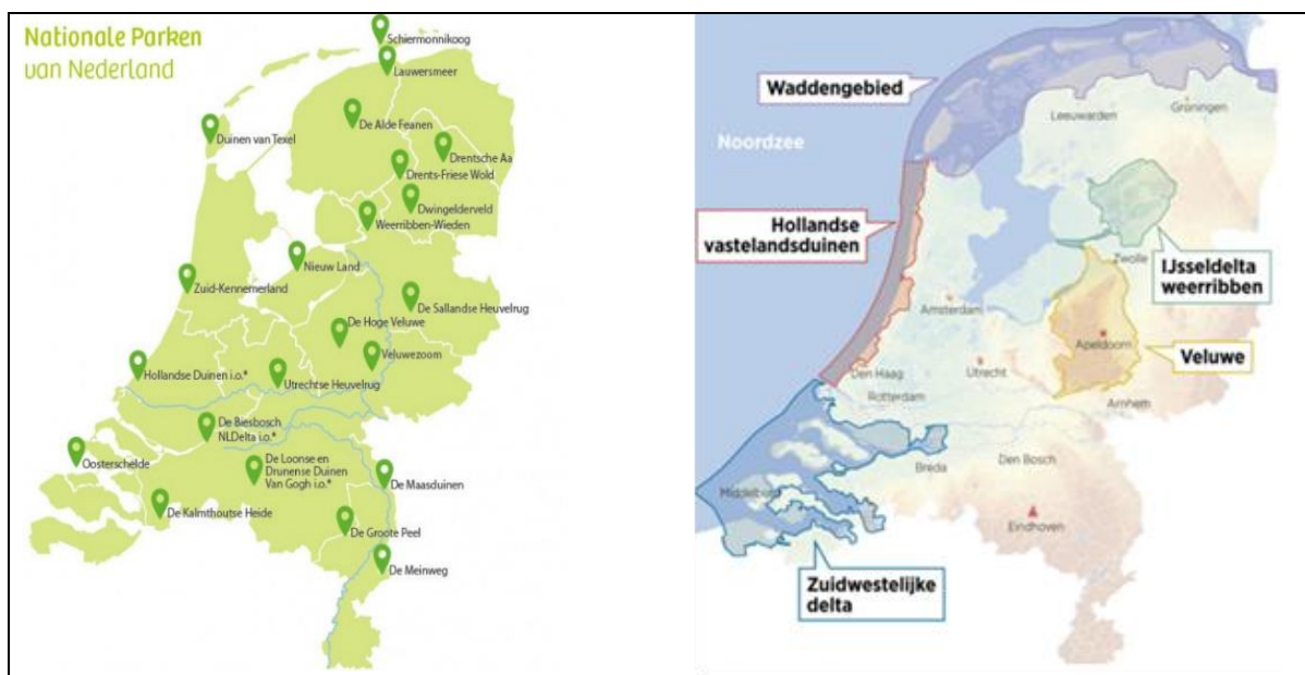
Figuur 2 Links de Nationale Parken en Nationale Parken in oprichting in Nederland. Rechts de voorgestelde selectie en begrenzing van vijf Nationale Landschapsparken door de Commissie Verkenning Nationale Parken.

In haar advies pleit de Commissie ervoor deze gebieden Nationale Landschapsparken te noemen. Deze gebieden zijn volgens de Commissie van internationale betekenis en voldoen aan de UNESCO-criteria. Daarmee onderscheiden ze zich van de Nationale Parken 'nieuwe stijl' en de oude, bestaande Nationale Parken (i.e. parken die de status van Nationaal Park hebben verkregen vóór 2018), die volgens de Commissie alleen van nationale betekenis zijn.