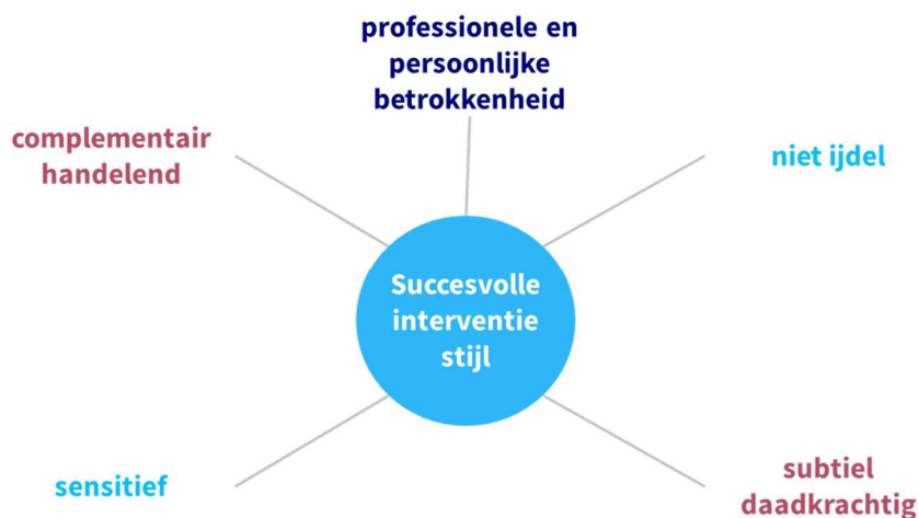
Figuur 3: 5 indicatoren van een succesvolle interventiestijl

Betrokkenen zijn het er over eens dat er in de periode 2014 – 2018 een programmabureau nodig was, dat intervenueert. Op het repertoire van interventiewijzen is geen kritiek, hoogstens is er op onderdelen verschil van mening (dit iets meer, dat wat minder). De breedte van dat repertoire wordt beschouwd als een kracht van het bureau. De kritiek op het bureau richt zich vooral op de stijl van werken van het bureau en de daarmee samenhangende positionering.