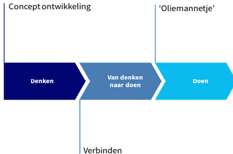
Figuur 2: Programmafases

Dat maatwerk is ook aan de orde in de verschillende fases die een programma doorloopt. Wij hanteren drie fases: denken, van denken naar doen, doen. Elke fase vraagt de inzet van een andere interventiewijze. In de volgende figuur is dit tot uitdrukking gebracht.