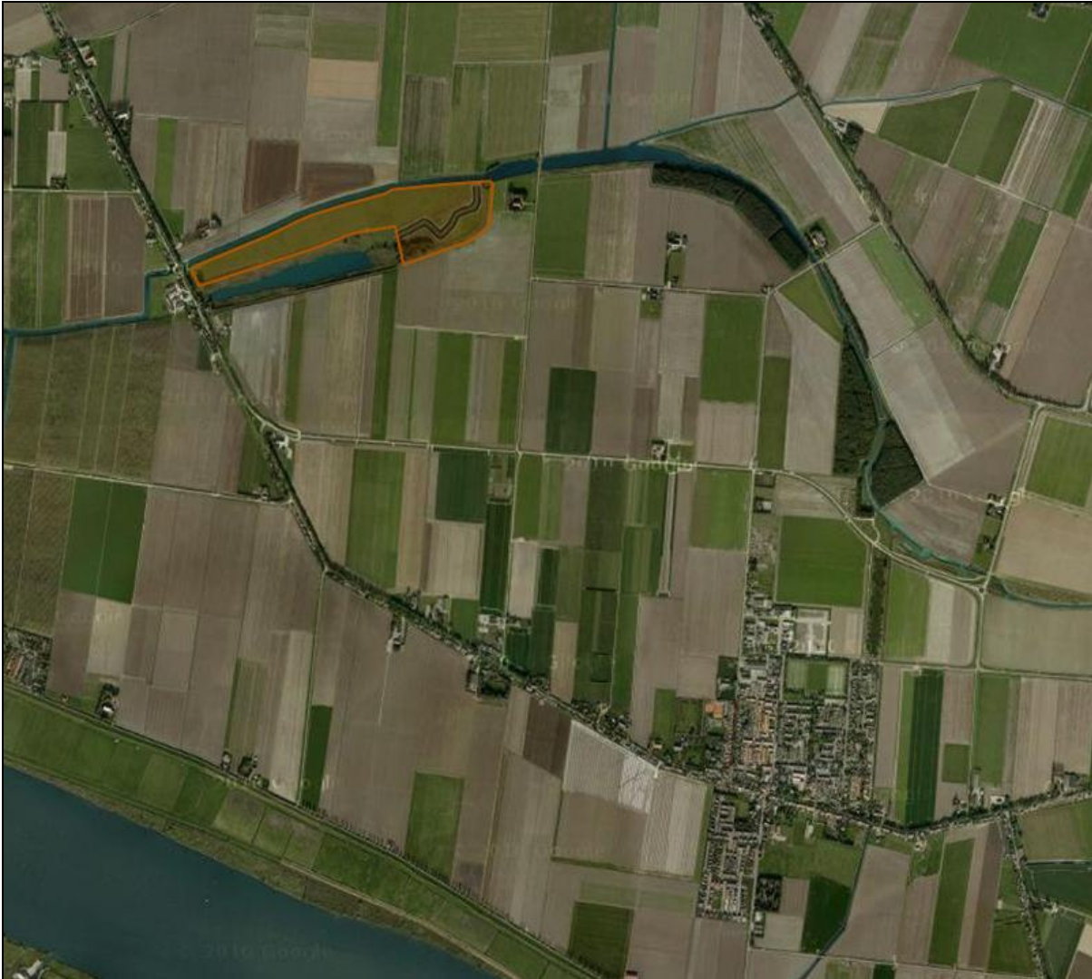
Figuur 2: Ligging Beschermd natuurmonument Groote Gat (detail).