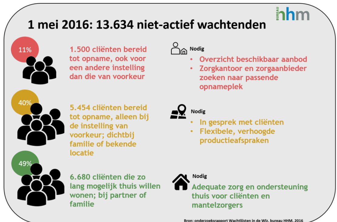
Figuur 1. Samenvatting rapportage wachtlijsten in de Wlz

Een derde groep cliënten heeft op dit moment geen bereidheid tot opname. Zij willen zo lang mogelijk thuis blijven wonen, ook al komt er een plek vrij bij de voorkeursaanbieder. Zij wonen veelal met een partner of een familielid. 49% van de mensen in deze groep geeft aan niet te willen verhuizen naar de aanbieder op het moment dat daar een plek vrijkomt. Van deze cliënten geeft 42% aan dat het thuis redelijk gaat. Van de mantelzorgers geeft 43% aan dat het verlenen van zorg redelijk gaat.