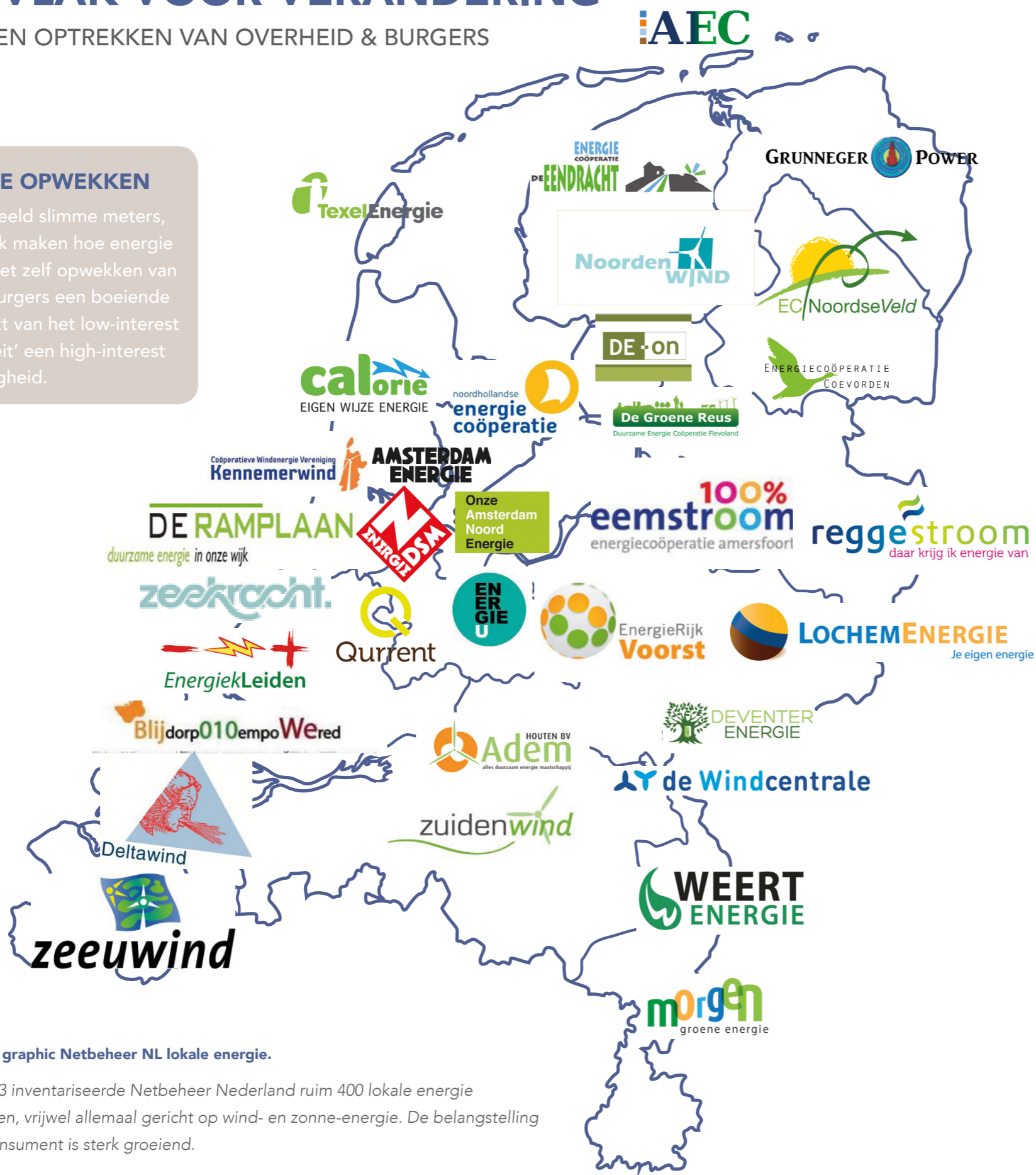
Figuur II. graphic Netbeheer NL lokale energie.

Meer dan bijvoorbeeld slimme meters, die alleen inzichtelijk maken hoe energie wordt verbruikt, is het zelf opwekken van stroom voor veel burgers een boeiende bezigheid. Het maakt van het low-interest product 'elektriciteit' een high-interest bezigheid.