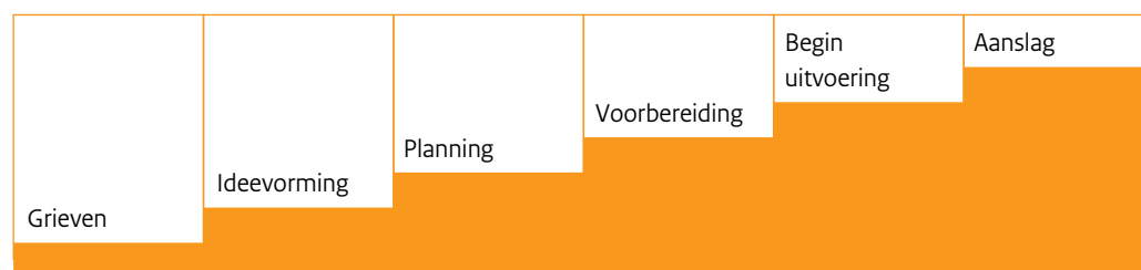
Figuur 1. 'Path to intended violence' (Calhoun & Weston, 2003; uit I-POL, 2007)

Daarmee kan onze doelgroep beschouwd worden als personen die meestal lijden aan een as I (in het psychotisch spectrum, met veelal paranoïde kenmerken) stoornis, in combinatie met as II-problematiek (cluster B, in het bijzonder de obsessief compulsieve stoornis); maar in een aantal gevallen zal er alleen sprake zijn van een as II-stoornis, wat het gedrag eerder gevaarlijker - zeker als gerichte actie - maakt. Des te ernstiger de as I-stoornis, des te minder gevaarlijk zal de persoon in kwestie zijn, althans specifiek voor de bedreigde. Dit komt ook tot uiting in het model 'path to intended violence' 14 .