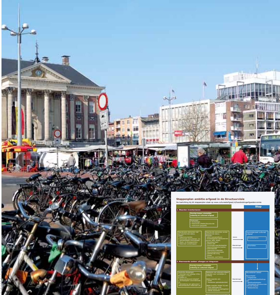
De Grote Markt van Groningen

Voeg uw eigen praktijkvoorbeeld toe op www.cultureelerfgoed.nl/handreikingerfgoedenuimte