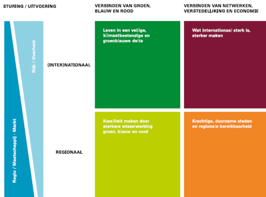
Figuur 2. De vier leidende principes uit Structuurvisie Randstad 2040.

Het Platform heeft als voorbeeld verkend hoe deze strategie zou kunnen worden vertaald in concrete projecten. De vraag die daarbij opkomt is hoe kennisontwikkeling zich ruimtelijk vertaalt in netwerken of plekken in de Randstad. Een mogelijk thema voor een Sleutelproject zou dan kunnen zijn om de verschillende campussen van universiteiten en kenniscentra beter te verweven met de steden en vorm te geven als hoogwaardige woon-, werk en verblijfsmilieus voor (inter)nationale kenniswerkers. Daarmee zouden unieke vestigingsmilieus aan de Randstad kunnen worden toegevoegd, terwijl tegelijkertijd de uitstraling als kennisregio kan worden vergroot.