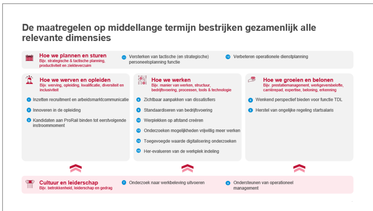
Figuur: voorgestelde maatregelen bestrijken alle relevante dimensies die wij op basis van onze ervaring zouden verwachten

Het aangescherpte plan van aanpak bevat maatregelen die op de middellange-termijn alle relevante dimensies bestrijken die wij op basis van onze ervaring zouden verwachten bij een dergelijk (operationeel) personeelstekort: planning, werving, opleiding, inzetbaarheid, groei, beloning en cultuur/werkbeleving.