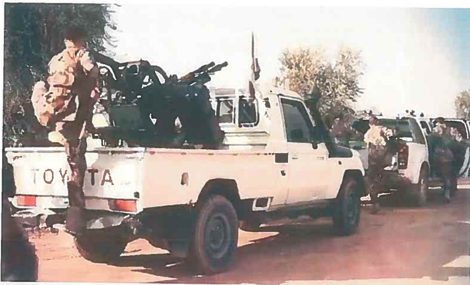
▲ Fragment uit een video van Jabhat al-Shamiya

Trouw en 'Nieuwsuur' onderzochten de afgelopen twee weken alle van de in totaal 1866 pagina's aan wob-documenten minutieus, en troffen daar opmerkelijke feiten aan. Hoewel de meeste documenten over het steunprogramma in Syrië zijn geweigerd, en het vrijgegeven deel ook nog eens veel zwartgelakte passages bevat, bleken de stukken per ongeluk staatsgeheime informatie te bevatten.