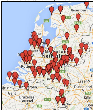
Figuur 3.3a Spreiding integrale voorzieningen