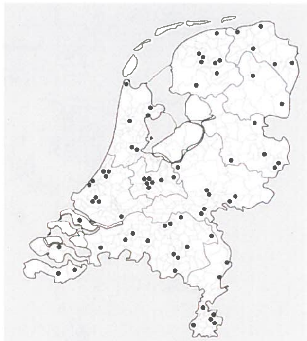
Figuur 1: Verspreiding van initiatieven over Nederland (n=72).

De 72 gevonden initiatieven verschillen sterk qua ontwikkelingsfase. Het ene initiatief loopt al meerdere jaren en is vooral bezig met opschalen, terwijl het andere initiatief recent is gestart. Ook verschilt de manier waarop de initiatieven hun populatie afbakenen. Men richt zich op één of meerdere wijken binnen een gemeente, op een hele gemeente of op een hele regio met meerdere gemeenten. Verder richt men zich op verschillende doelgroepen binnen de populatie, bijvoorbeeld kwetsbare ouderen, chronisch zieken, zwangeren of jeugd.