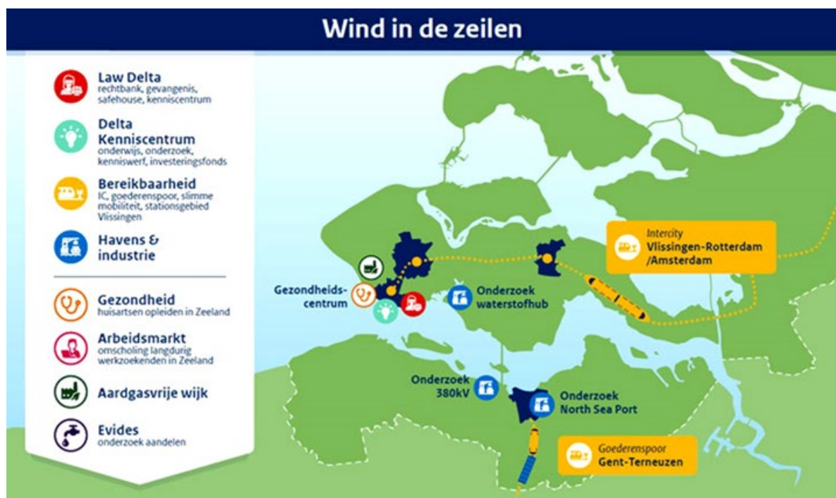
Figuur 1: Een overzicht van de diverse projecten uit het pakket Wind in de Zeilen

Zo maakt het totale pakket het voor de regio mogelijk een sprong in verdien- en concurrentievermogen te maken, die weer leidt tot nieuwe aantrekkingskracht, nieuwe vestigingskansen en banen. Dit moet leiden tot een groeiend aantal jongeren en jonge professionals dat zich in de regio vestigt en zo een positieve invloed heeft op onderwijs, sociale voorzieningen, cultuur, kwaliteit van leven en bestedingen in de regio.