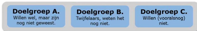
Figuur 1. Er zijn drie groepen te onderscheiden van mensen die nog niet gevaccineerd zijn.

De interventies die de GGD'en de afgelopen maanden hebben ingezet, zijn vooral gericht op doelgroep A: mensen die zich willen laten vaccineren, maar dat om wat voor reden dan ook nog niet hebben gedaan. Zij ervaren vaak fysieke barrières, die weggenomen kunnen worden door interventies als prikkenzonderafpraak.nl, de prikbus, de vrije inloop, pop-up locaties, etc. Daarmee zorgen de GGD'en ervoor dat het daadwerkelijk laten zetten van de prik zo makkelijk mogelijk wordt gemaakt. Maar ook wordt op doelgroep B ingezet met duidelijke informatie op meerdere manieren en met meerdere kanalen.