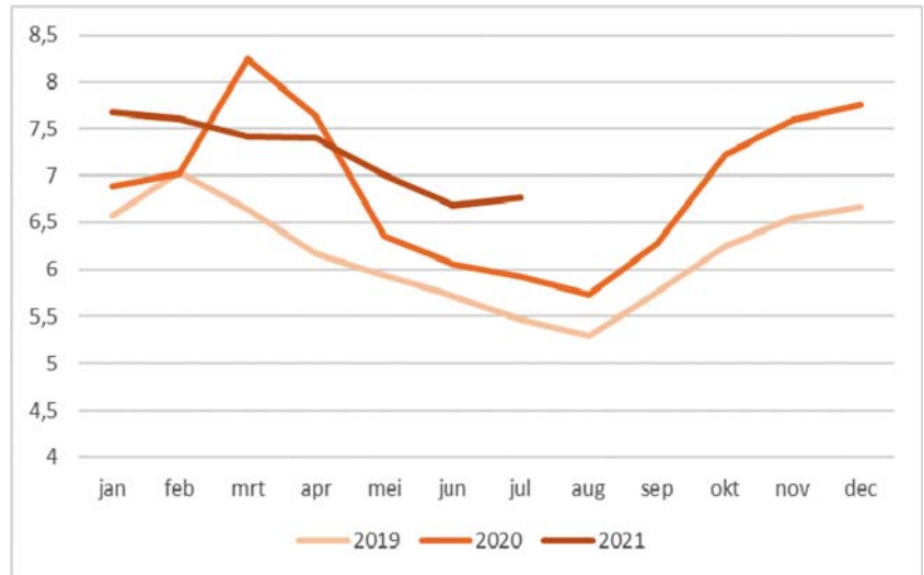
Figuur 3: ziekteverzuim zorgpersoneel (zorgbreed)