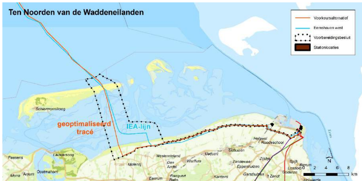
Preferred trajectory as determined by the Dutch Minister of Economic Affairs and Climate in February 2021. This means cable-digging right in the middle of the Wadden Sea.