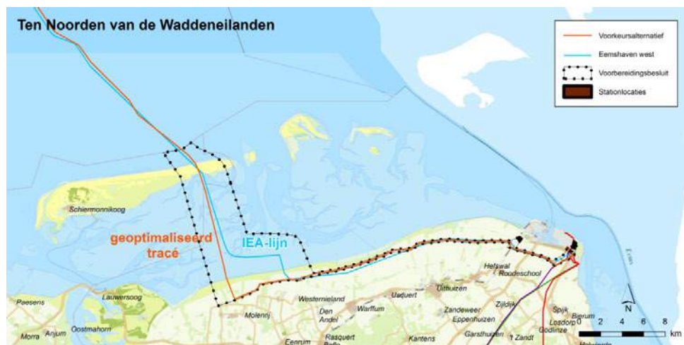
Overzicht voorkeursalternatief Eemshaven west met zoekstrook en inclusief de twee opties voor een transformatorstation

Ten aanzien van het transformatorstation zijn voor de route Eemshaven west twee opties mogelijk in het Eemshavengebied: de locatie Waddenweg en de Middenweg. Beide locaties lijken nu erg gelijkwaardig en worden komende maanden verder uitgewerkt, waardoor de geschiktheid beter ingeschat kan worden en mijn ministerie een keuze kan maken voor het beste alternatief.